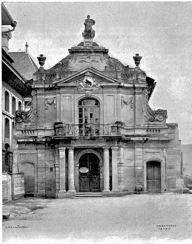
Fassade an der Nordseite des alten historischen Museums in Bern (Phot. A. Krenn, Zürich).