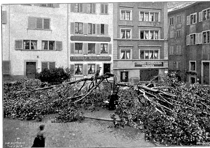
Vom Mai-Unwetter 1908. Die Platanen auf der St. Peterhofkalt in Zürich.

an, daß ein Maler eine ausgesprochene Vorliebe für die sogenannten kalten Farben zeigt, so werden seine Bilder nach dieser Forderung nur denen gefallen und als natürliche Nachbildungen der Natur erscheinen, die das gleiche Farbensystem wie der Maler, etwa eine Schwäche für blau, besitzen und die also quasi als Sinnesgenossen des Malers aufzufassen sind. Allen andern wird das Gemälde unnatürlich und daher unschön erscheinen. Diese Forderungen wurden durch die Untersuchungen von Heine und Lenz, die sie an Kunstmalern anstellten, insofern widerlegt, als diese Autoren keine so großen individuellen Verschiedenheiten in der Beurteilung der Farben an diesen Versuchspersonen nachweisen konnten. Raehlmann legt auch bei der Beurteilung eines Bildes entschieden zuviel Wert auf die Farbe allein; denn was wir an einem