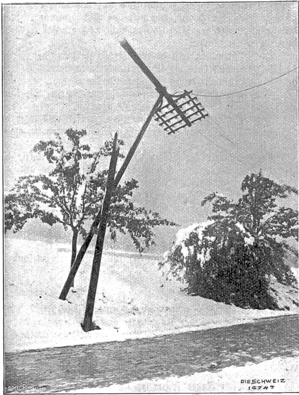
Vom Mai-Unwetter 1908. Durch Schneeeindruck gebrochene Telegraphenstange ob Fluntern-Zürich.

hörten ihr atemlos zu. Plötzlich aber brach sie ab, obschon die Geschichte noch nicht ganz zu Ende war und die Zuhörer das Wichtigste von allem noch nicht erfahren hatten, ob nämlich Baron Mannersköld zum Tode verurteilt oder freigesprochen worden war.