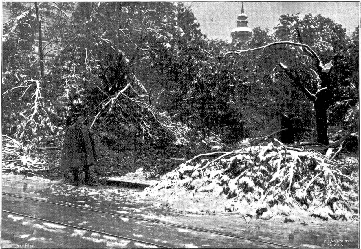
Vom Mai-Unwetter 1908. Verwüstungen in den Stadthausanlagen zu Zürich.

Bilde auszufragen haben oder was uns daran gefällt, hängt nicht allein von der Farbenkomposition, sondern von der ganzen künstlerischen und persönlichen Auffassung und Wiedergabe ab. Immerhin ist es einleuchtend und denkbar, daß ein Maler mehr Farbennüancen empfindet und sie anders sieht als der Laie.