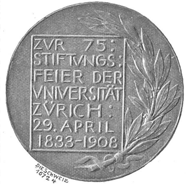
Zürcher Hochschul-Medaille, Rückseite.

Fast gleichzeitig hatte der Medailleur auch zum fünfundsiebzigsten Geburtstag der Alma mater Turicensis eine Gedenkmedaille zu schaffen, die wir gleichfalls hier im Bilde vorführen. In ihrer vornehmen Schlichtheit, prunklos, doch würdig gehalten stellt sie sich dar als eine schöne Erinnerung an den 29. April 1908, ein in der Geistesgeschichte Zürichs bedeutendes,