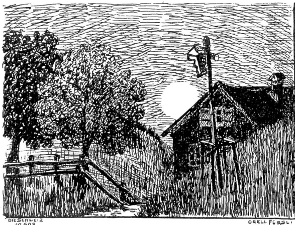
Motiv bei Appenzell. Nach Federzeichnung von Olga Amberger, Zürich.

„So sind sie alle, alle . . . Schuft du!“ schrie Lora, stürzte auf den Direktor zu und schlug ihn ins Gesicht.