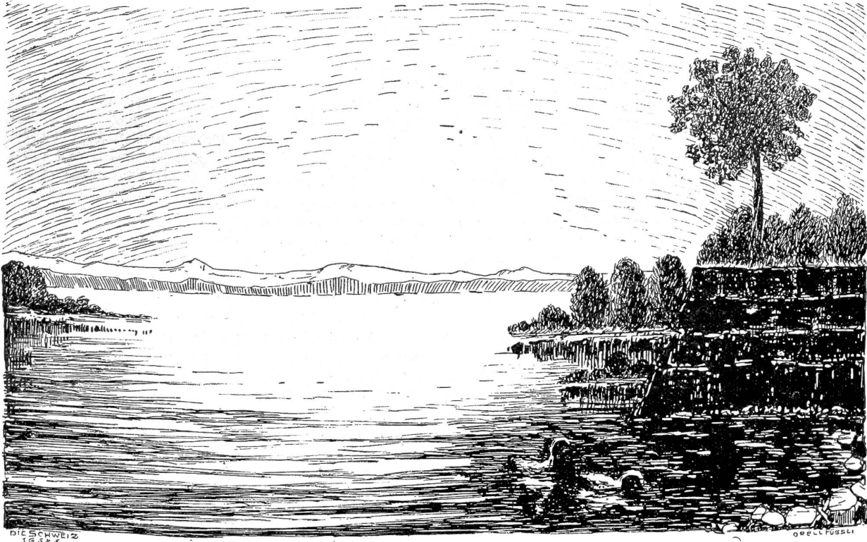
Abend am See. Nach Federzeichnung von Olga Amberger, Zürich.

als Gaukler gefährlicher Künste hinrichten zu lassen, da sie noch nie solche Haufen Gold und Silber gesehen hatten. Jost hatte aber der Vorsicht halber immer ein Köllchen Goldvögel in seinem Gurt eingenäht, davon nahm er zwei heraus, bestach die Kriegsknechte, die ohnehin schon neidisch auf ihre Herren waren, und lief davon und kam nach Dribeer, wo er sich sicher fühlte. Das lebensfrohe Städtchen gefiel ihm; er sah gleich am ersten Abend mit verstohlenem Lachen, wie leicht die Bürger ihr Geld beim Zechen hergaben oder verspielten. Er beschloß, sich hier als Krämer von neuem Geld zu erwerben. Er setzte sich nach und nach zu den bessern Leuten, trank vom guten Wein, sprach zum Spiel und machte gleich mit. Als er verlor, ließ er Goldstücke wechseln, die den Ratsherren und Bürgern ordentlich in die Augen stachen, und tat, als ob er noch viele solcher zu verlieren hätte. Er erzählte von weiten Reisen, schwer geladenen Wagen mit Gewürzen aus Indien, von köstlichen Gewändern und trieb zum weitem Spiel, gab vom Haufen abgeschliffener Münzen, was es ihn gerade traf, oder strich sie ein, lobte den Wein und fragte nach den Neben. Alle sahen den Fremden für einen Herrn an, der ihrer Wirtsstube gut anstehe. Damit hatte er gewonnen; der Rat erlaubte ihm, im Städtchen zu bleiben und seine Geschäfte abzuwarten. Sonst hätten sie ihn leicht vors Tor gesetzt; sie hatten kein großes Zutrauen zu unsteten Leuten.