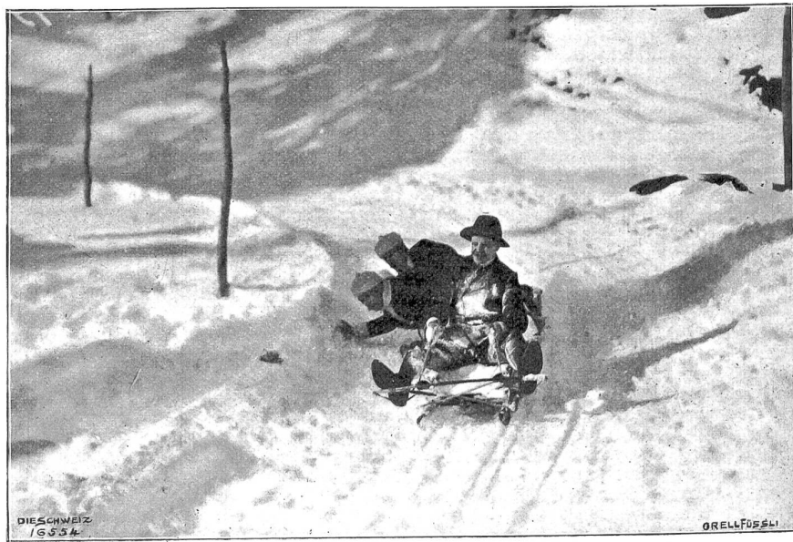
Vom Bobsleigh-Rennen auf der neuen Schlittbahn Schatzalp-Davos. In der Kurve.

charakteristischen Schönheiten unserer Städte und Dörfer längst geliebte und wieder ganz ungreiflich übersehene Bilder und wohl ein jeder bisher unentdeckte beglückende Zeugen der alten Schweizer Baukunst. Das beginnt mit der malerischen Torpartie am Fuße des alten Narau und dem flotten Rollinbrunnen des schmucken alten Zug. Da kommen die antiquarische Perle der welschen Schweiz, Estavayer, dann das wundervolle gotische „Stöckli“ von Kerns und das lauschige breitgehäbige „Winkelriedhaus“ zu Stans, viel stattliche Junfer- und Bürgerhäuser von Bern, die Münchsteinen „Au“ und das Bergünner Gerichtshaus, wie es war, und das Märchen im Grünen am Bielersee, das „Haus des Junkers von Ligerz“. Da sind die burgbekrönten Städtlein von Thun und Lenzburg mit ihren Prachtsgassen, die feine Eleganz des Treppenhauses in der Maison de la Pierre in St. Maurice, Asconas berühmte Casa Borrani. Feine Interieurs aus Genf und Zürich lernen wir kennen und schöne Portale aus Basel. Wir können nicht von ihnen allen erzählen. Neuenburg und Lausanne, Biel, Bözingen, Twann, St. Gallen, Locarno, Glarus, Solothurn, Luzern, Engadin und Prättigau, Münsfirtal und Herrschaft, Altdorf, Schwyz, Winterthur, Appenzell und Thurgau steuern die weitere Folge zusammen. Es ist eine Anregung. Vor dem einen, was dasieht, erwacht unser inneres Auge, und zehn