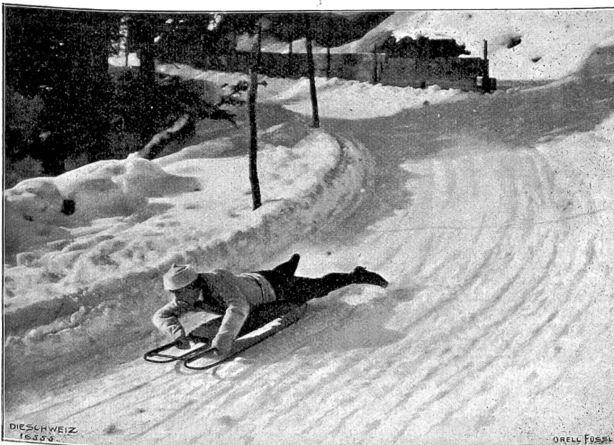
Vom Bobsleigh-Rennen auf der neuen Schlittbahn Schatzalp-Davos. Das besonders von Engländern geliebte Räuchlingsfahren (Phot. Billy Schneider, Davos).

Vor einigen Jahren stand am Fikroy Square ein kleines, schmales und sehr baufälliges Haus mit schmutzigen, geschwärzten Verzierungen in Stuckarbeit. In der Breite hatte es nur zwei Fenster, war aber dafür drei Stock hoch wie so manche der kleinen Londoner Häuser. Das ganze Quartier ist dann niedergelassen und durch einige hübsche, aber sehr prosaische Backsteinbauten ersetzt worden. Zu dem in nächster Nähe gelegenen schmucken und belebten Vorland-Platz bildete Fikroy Square eine schäbige, ärmliche Nachbarschaft; nur die prächtigen Bäume, die während der schönen Jahreszeit fächernd und rauschend angenehme Kühlung und Schatten spendeten, gaben dem Ort ein freundliches Gepräge und verloren selbst im Winter, wenn sie kahl und schwarz sich vom grauen Nebel abhoben, nicht an Reiz.