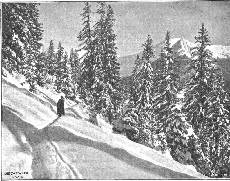
Winter im Gebirge (Phot. Wlly. Schweizer, Davos).

scher Wind jagte die dicken hängenden Wolken am Himmel nutzlos umher — — — — —