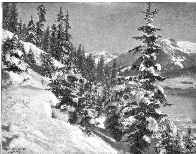
Winter im Gebirge (Phot. Billy Schweizer, Davos).

Was der Schweizer anfaßt, das packt er mit großen Händen. Diese Art schafft uns das Schweizerische Idiotikon, um das uns das Ausland beneidet, die märchenreiche Sammlung unserer Sprache, eine ungeheure Aufgabe für den Fleiß und die Liebe der Schatzmeister, die viel mehr gewürdigt werden sollte und von Rechts wegen zur Hausbibliothek unserer Bürger gehörte. Ist sie doch allmählich in mäßig angelegten Lieferungen zu beziehen. Kein Buch ist mehr zu unserem vertrauten Freund und Erzähler gemacht als dies Schatzkästlein unserer Lieder- und Spruchweisheit und all die alten Bräuche be-