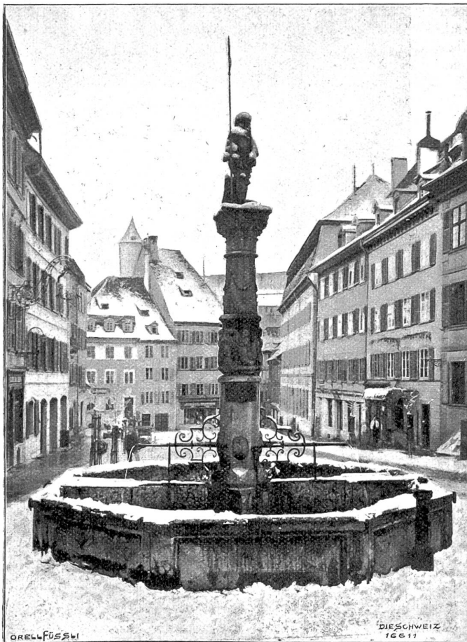
„Le Suisse“, alter Brunnen in Pruntrut.