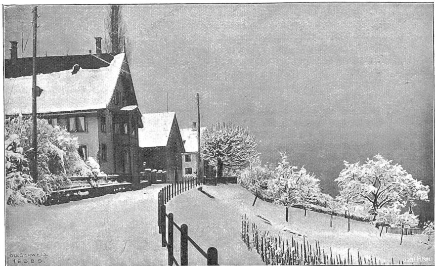
C. F. Meyers Haus in Kilchberg, wo er mit seiner Familie vom Frühling 1877 bis zu seinem Tode (28. Nov. 1898) lebte.

Es braucht hier nicht wiederholt zu werden, was allgemein bekannt ist, daß nämlich das Privatleben Wagners mit den Forderungen des christlichen Sittengesetzes auf gespanntem Fuße stand. Aber ebenso wahr ist es, daß Wagner das Tiefdemütigende und Herabwürdigende dieses Zustandes aufs bitterste fühlte und nach Befreiung rang mit der ganzen Kraft seines Mißenseintes, ohne es weiter zu bringen als zur Ermattung des Alters. Das entdeckt man freilich nicht im Tannhäuser, aber um so sicherer und klarer im „Parsifal“. Auch da, wie im Tannhäuser, ist es das Ideal der Keuschheit, das er als die höchste Stufe des Lebens bezeichnet, und wie er selbst Tannhäuser ist, der aus dem Venusdienst heraus sich sehnte nach der Erlösung, so ist er als bejahrter Mann in seinem „Parsifal“ der Zauberer Klingsor, der auf die Frage Kundry's: „Bist du keusch?“ antwortet: „Was fragst du das, verfluchtes Weib? Furchtbare Not! So lacht nun der Teufel mein, daß einst ich nach dem Heiligen rang? Furchtbare Not! Ungebändigten Sehnsens Pein, schrecklichster Triebe Höllebrand, den ich zum Tode schweigen mir zwang, lacht und höhnt er nun laut durch dich, des Teufels Braut?“ Das ist deutlich, und es ist erschütternd zugleich. Hält man damit jenen bekannten