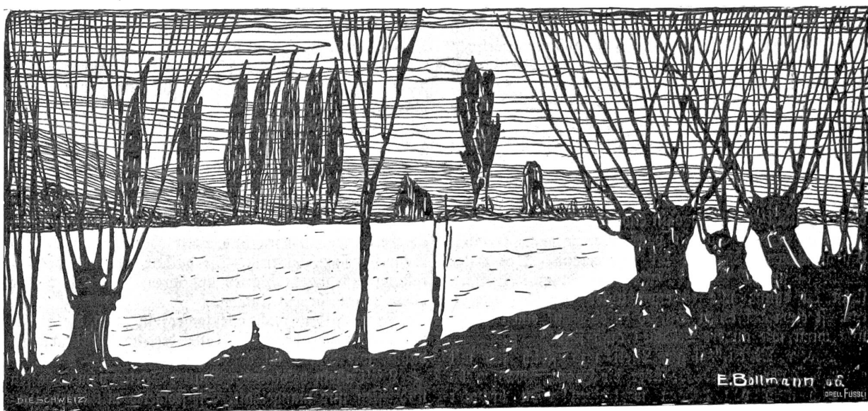
Am Rhein bei Kehl. Nach Federzeichnung von Emil Bollmann, Winterthur-Düsseldorf.