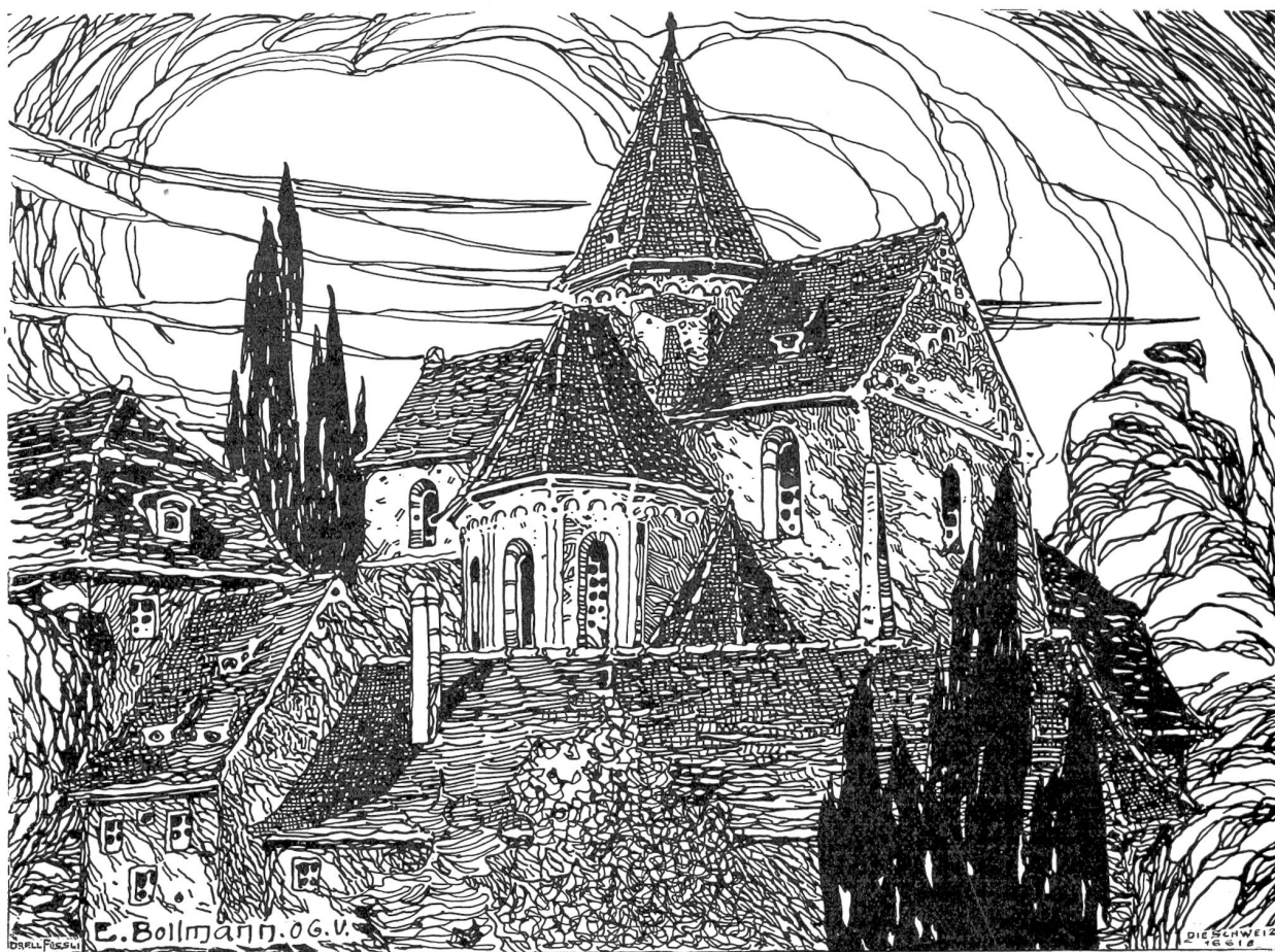
St. Stephanskirche zu Straßburg i./E. Nach Federzeichnung von Emil Bollmann, Winterthur-Düsseldorf.

mit so einer Heirat fast nicht kommen darf! Der Christen war unfer Knecht! Wir können dahinten im Tschingelhof haben solche Sachen von jeher nicht als so wichtig angesehen wie die Mutter. Sie kommt aus dem Emmental, wo alles seinen ruhigen Gang geht und hell und heiter ist und die Leute erst ans Sterben denken, wenn der Tod sie beim Kragen hat. Aber wir hier herum sind näher dabei: die Lawinen, die Steinfälle, die Wasser, die jahrein, jahraus donnern, und die Leute, die erfallen ... Ich weiß nicht, es kommt mir halt nicht so wichtig vor, ob einer mehr oder weniger hat; es nimmt doch alles ein Ende, und er muß es hergeben!"