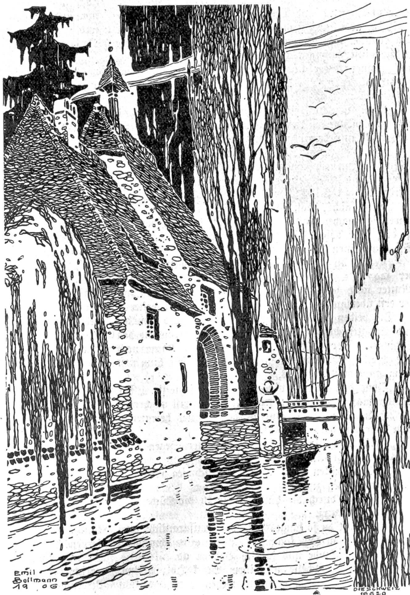
Motiv aus Ittenwiller i./E. Nach Federzeichnung von Emil Bollmann, Winterthur-Düsseldorf.

Und nun sollte Liseli fort, nach der Stadt. Sie wußte sich nicht anders zu helfen, als daß sie ein paar zerrissene Schuhe nach Kiental trug, wie die Mutter ihr