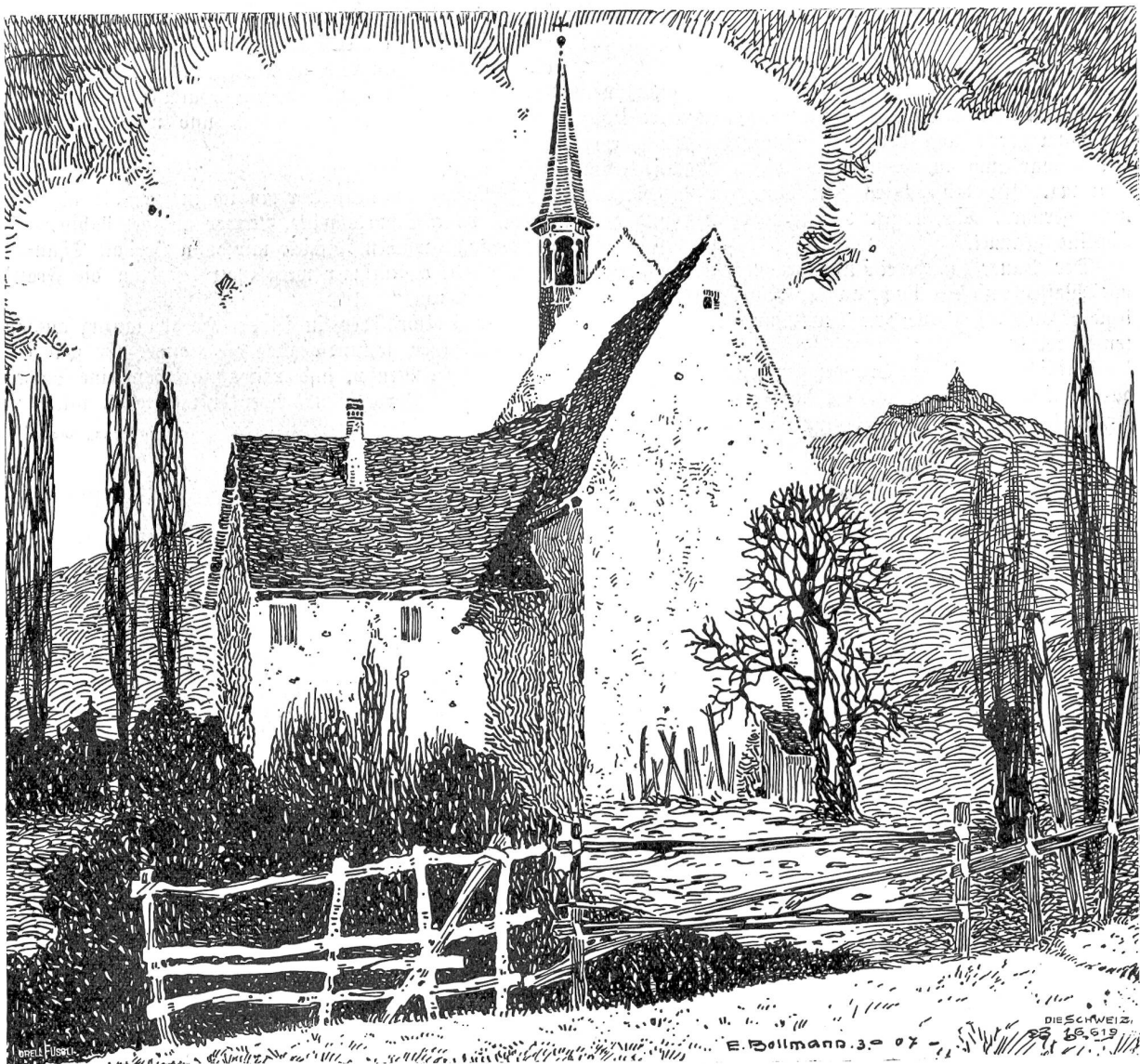
Reitenholz bei Schlettstadt (im Hintergrund Hofkönigsburg). Nach Federzeichnung von Emil Bollmann, Winterthur-Düsseldorf.

"Liseli, rufe Gisi; sie soll helfen!" Aber hilflos schüttelte Liseli den Kopf. Sie konnte nicht aufstehen und saß auf dem Stuhl neben der Mutter, die Hände ins Bettuch gekraßt, sich krampfhaft festhaltend.