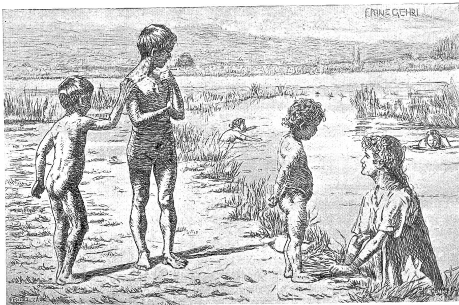
Im August. Nach der Originalabdrucker von Franz Gehrl, Münchenbuchsee.

„Ich habe Böses durchgemacht, weil mein Volk unzufrieden war mit mir und weil ich an dich glaubte.“