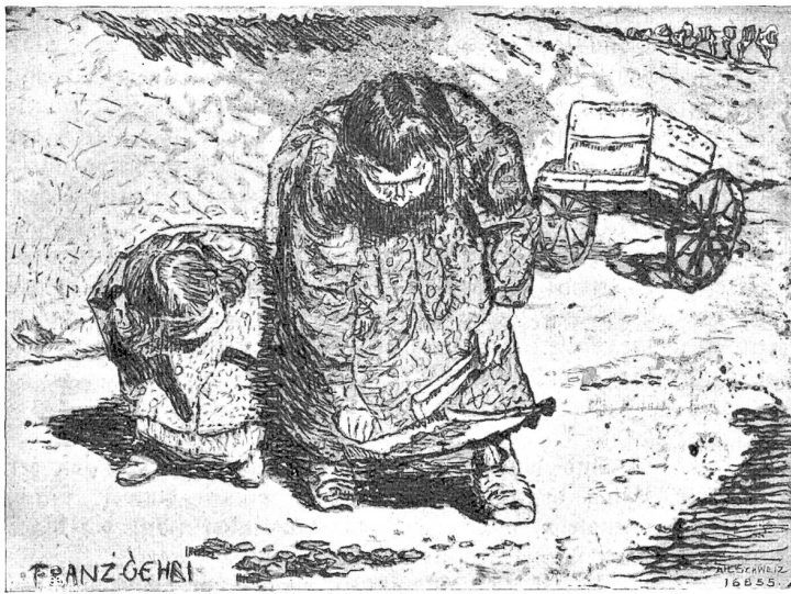
Tägliche Beschäftigung. Nach der Originaltrabierung von Franz Gehri, Münchenbuchsee.

Nun hast du den Glauben zur Wahrheit gemacht und wirst mir weiter helfen!"