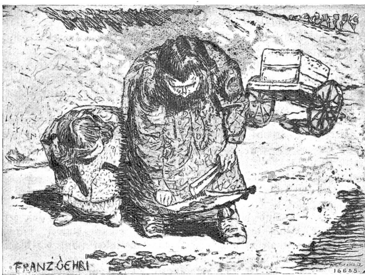
Tägliche Beschäftigung. Nach der Originalabildung von Franz Gehri, Münchenbuchsee.

Nun hast du den Glauben zur Wahrheit gemacht und wirfst mir weiter helfen!"