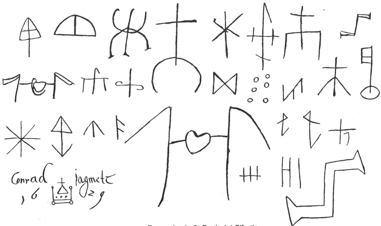
Hausmarken in St. Agatha bei Disentis.