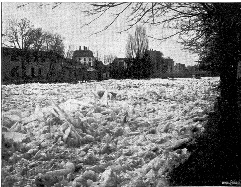
Vom Eisgang der Sihl (bei Zürich). Der Eisstau oberhalb der neuen Uto-Brücke.

Die am Silvester 1906 plötzlich eingetretene erhebliche Temperaturerhöhung mit zeitweisem Regen bewirkte am Neu-