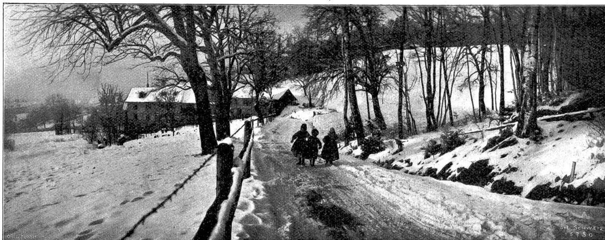
In der obern Klus am Zürichberg (Phot. Leuz Moser, Zürich).