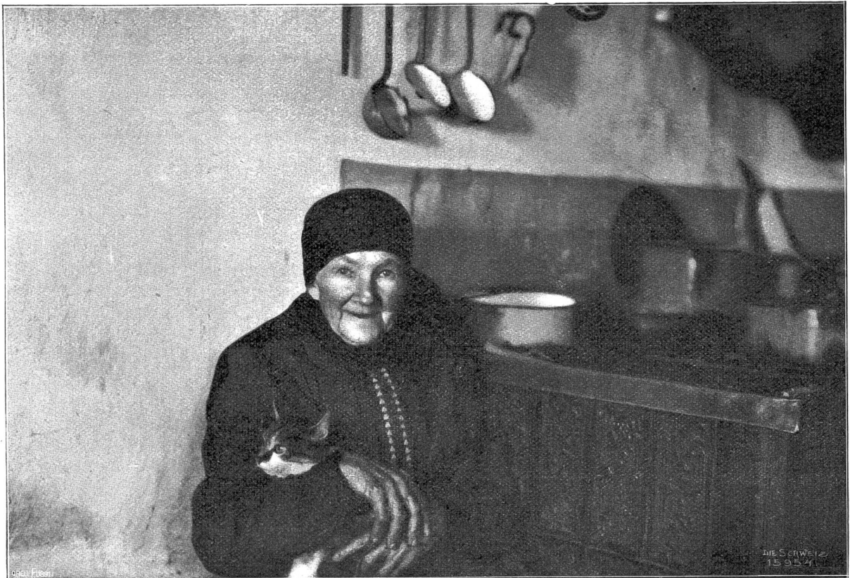
Großmutter's Lieblingsplatz. Nach photographischer Studie von Carl Keller, Zürich.

schwäbischen Meere und sah ein weites weites Land und hörte in der Ferne den frohen Wandergefang der Bur-schen aus dem Heimatland. Da wurde das alte Herz mürbe, Verstehen und Verzeihen zog hinein und damit ein ganzer Festtag. Und die also geläuterte Maid setzte sich auf ein Bänklein und sprach philosophisch: „Ich alter Esel! Jung Volk muß wandern, du auch, Hansjakob!“