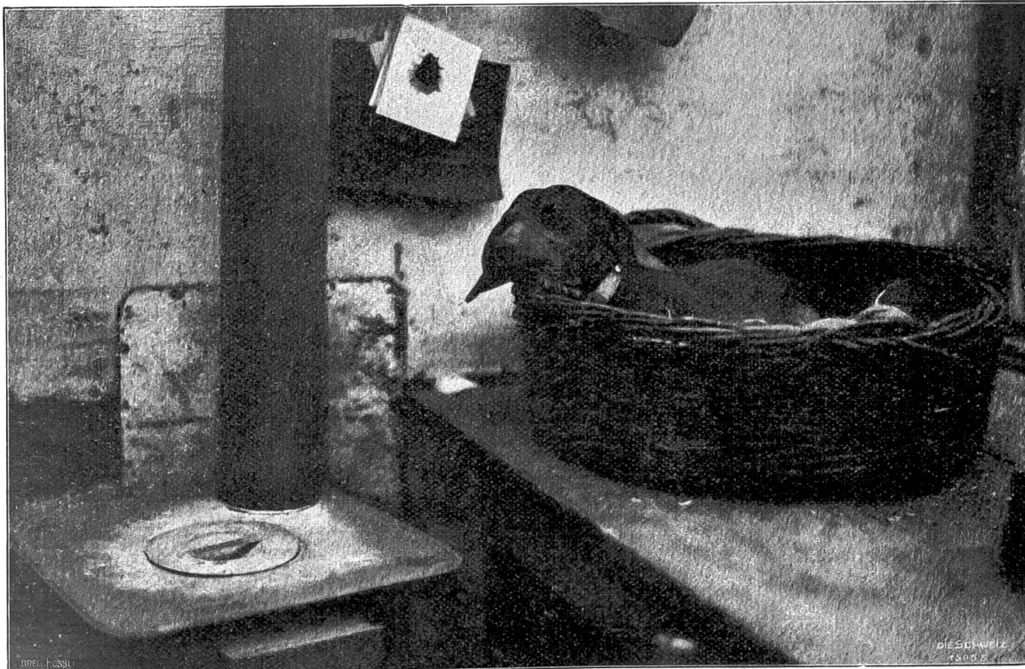
Siesta. Nach photographischer Studie von Carl Heller, Zürich.

Das Schiff hatte gerufen, und um den Himmelfahrer standen seine Gefährten, der König von Thule, die Seelen-