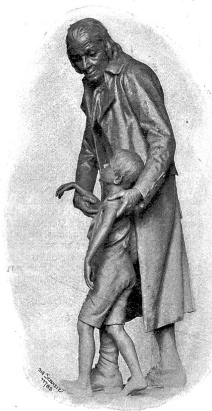
Pestalozzi-Denkmal in Zürich (1898).