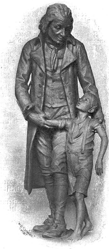
Pestalozzi-Denkmal in Zürich (1898).