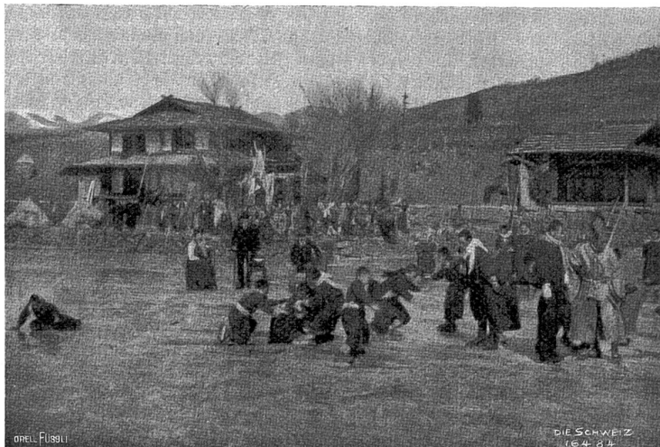
Auf dem Suwako. Wettrennen.

die Zeit zur Abfahrt; doch hatte sich der Himmel, der uns vier Tage so gnädig gewesen, bewölkt, und wie wir die Schlitt-