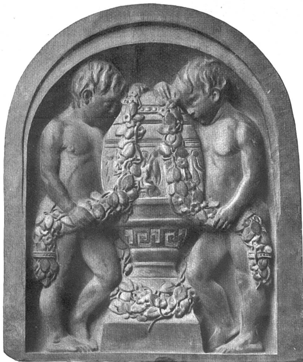
Grabrelief (1906) von August Seer, Basel-München.

Zu Füßen stürzt ihr Psyche und benezt der Göttin Kleid mit ihren Tränenbächen; am Boden schleift ihr Haar, da sie zu sprechen beginnt mit vielem flehn: „O Göttin, höre auf meine heißen Bitten: ich beschwöre bei deiner Rechten dich, der fruchtoreichen, bei deiner Ernte heiligen Gebräuchen, bei der Mysterien geheimen Sagen, wo Flügeldrachen ziehen deinen Wagen, bei deiner Wandrung durch Siziliens Auen und da du suchen gingst durch alle Gauen die Tochter, bei des Orcus Finsternissen, wo jene weilt, die Pluton dir entriß, bei ihrer Rückkehr, die die Freude weckt, und was noch sonst mit heil'gem Schweigen deckt Eleusis — habe, Göttin, mit der armen Psyche, die deinen Schutz ersleht, Erbarmen! Erlaube, daß ich hier — und wär's auch nur für ein'ge wen'ge Tage — meine Spur verberge unter diesem Haufen Korn, bis daß die Zeit der Göttin wilden Zorn gelindert oder bis sich meine Kraft, die von des Wanderns langer Müh' erschlaft, erholt hat durch die Ruhe!“ — „Mich rührt sehr,“ sprach Ceres drauf, „dein flehn, und dein Begehrt erfüllt' ich gern; doch ist mir nah verwandt Frau Venus, und ein altes Freundschaftsband verknüpft uns beide, und da ohnehin sie eine brave Frau sonst ist, so bin ich außerstande, gegen ihren Willen zu handeln und dein Bitten zu erfüllen. Verlaß denn dies mein Haus sofort und halt'