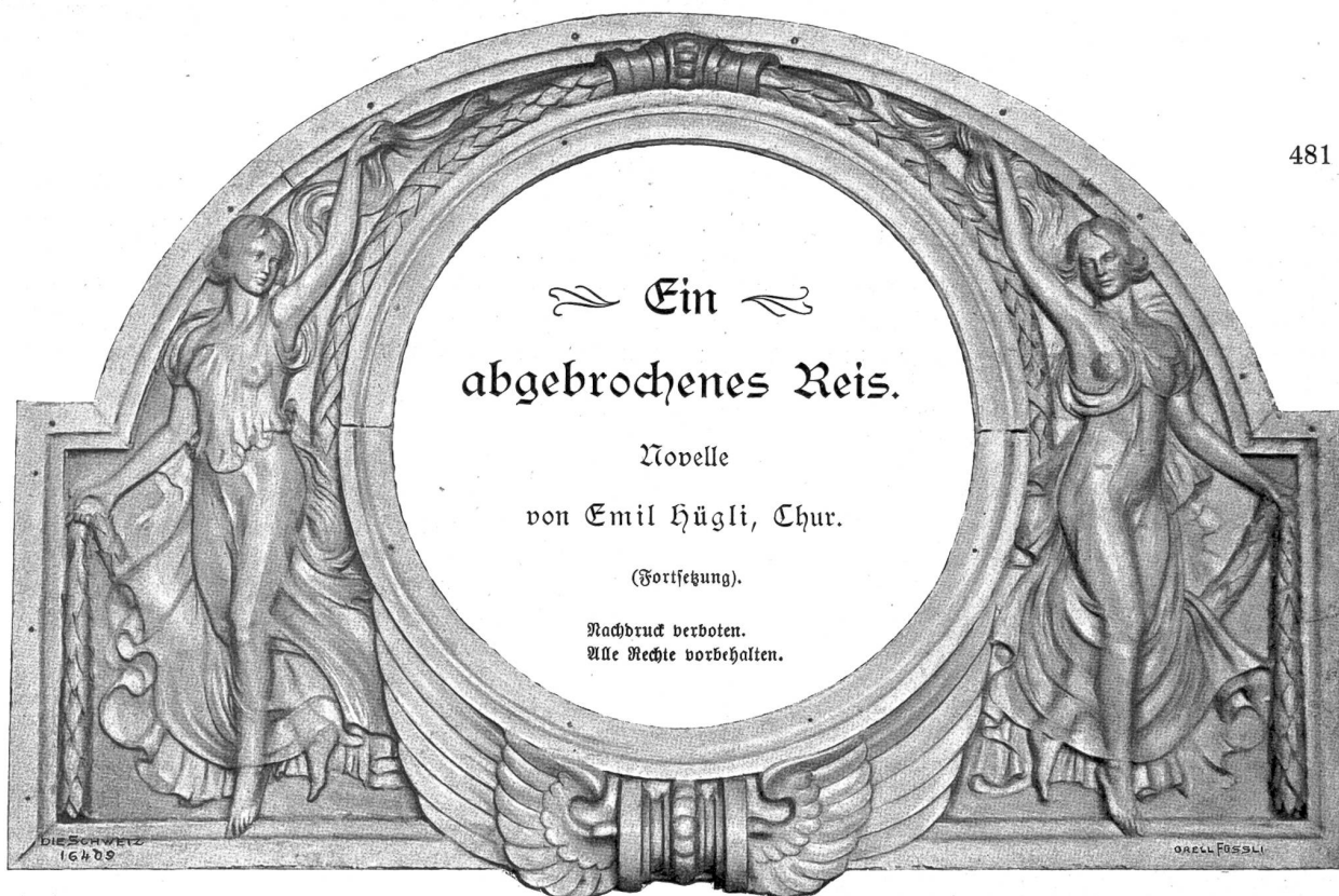
Uhrenrelief am Basler Bahnhof (1906) von August Geer, Basel-München.

L ehrer Löner hatte diese Abkantung kaum vollendet, als sich drüben beim Fenster Willy Wildbolz erhob; sein schmales feines Gesicht war bleich vor mühsam verhaltenem Zorn, und seine blauen Augen blitzten. Entschlossen klang seine helle Stimme, indem er ausrief: