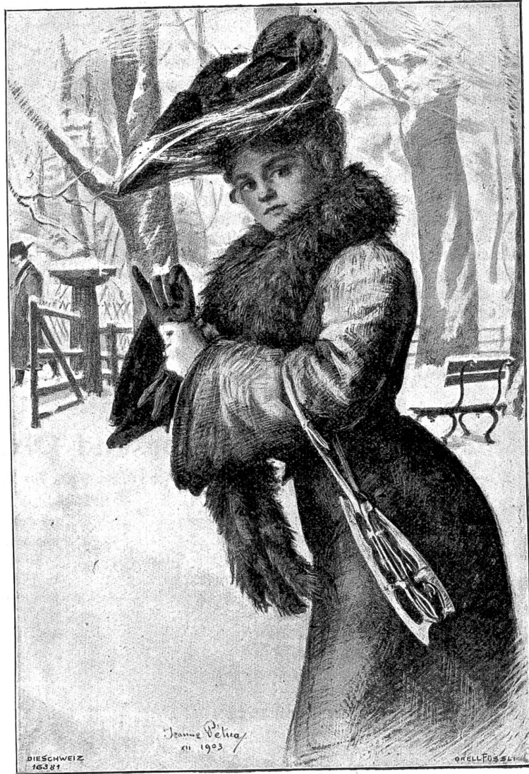
Schlittschuhläuferin. Nach Originalstichographie von Jeanne Pétia, Winterthur.

Ein ohrenbetäubendes Gepolter rasselte jetzt in seine Träume. August zuckte zusammen. Aufschauend sah er, wie alle seine Mitschüler emporgefahren waren, gleich Rekruten in Achtungstellung dastanden und nach der plötzlich aufsteigenden Tür starrten. Dort stand der rotbärtige „Ton“ schon auf der Schwelle und spähte mit