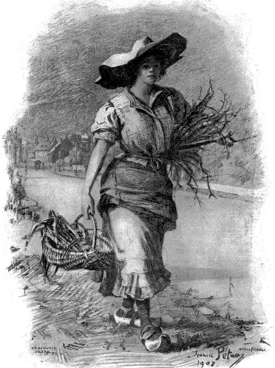
Bauernmädchen aus dem Jura. Nach Original lithographie von Jeanne Pétua, Winterthur.

„Jetzt zeige, was du kannst!“ Es war ihm, als hätte die kraftvolle Stimme des Vaters diese Worte ausgerufen. Von jungem Heldenmut erfüllt, tauchte er unter. Der Körper des Lebensmüden wurde jetzt von den Wo-