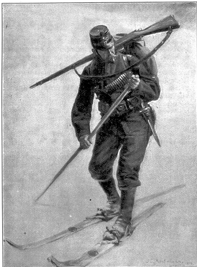
Gotthardsoldat als Skiläufer. Nach dem Delgemälde von J. C. Kaufmann, Luzern, im Besitz des Herrn Oberstl. Ernst in Pfungen.

fernt gelöst werden muß. Es gilt hinabzusteigen in den tiefen Einschnitt eines wilden Bergbaches und jenseits hinauf bis an den so nahen und doch so weiten, die eigene Stellung flankierenden Grat, ein Sicherheitsposten zu sein in der Flanke seiner Kompanie oder Meldung zu bringen hinüber zum Standort der Nebenkolonie, die jenseits des Kammes in gleicher Richtung vorgegangen wie wir. Das kostet Kraft und Ausdauer und verlangt guten Willen und Energie; denn gar bald ist man in diesen Gegenden den Vorgesetzten aus den Augen. Aber Freude erfüllt das brave Soldatenherz, wenn der Auftrag geglückt, wenn er Erfolg gebracht!