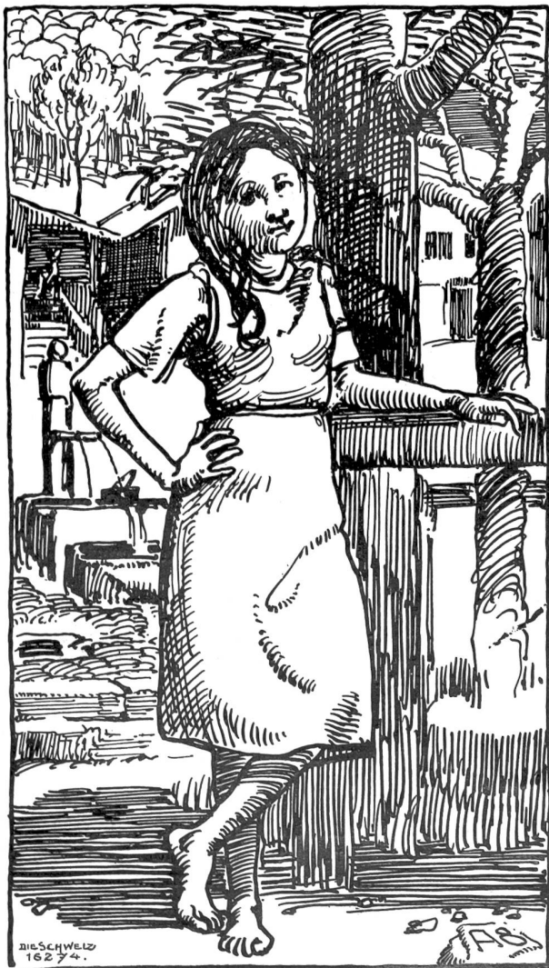
Frühling. Aus den „Federpfafen“ von Alexander Soldenhoff, Glarus.

Keiner wußte darum, keiner sollte es je erfahren — auch er nicht — nie, nie! Kein Schatten sollte auf seinen Weg fallen, nichts ihn daran mahnen, daß er in