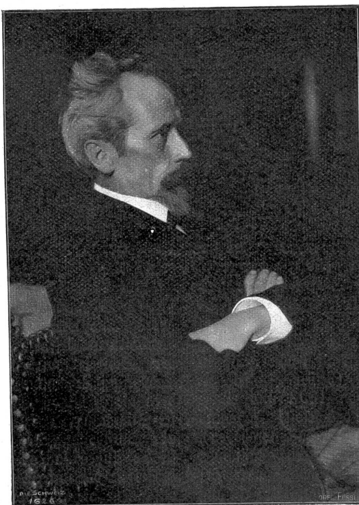
Wilhelm Ludwig Lehmann.

Doch es ist Zeit, rasch über den Lebensgang des Künstlers ein paar Worte zu sagen. Wilhelm Ludwig Lehmann wurde 1861, am 7. März zu Zürich geboren als Sohn eines Arztes. Die Familie stammt aus der Pfalz. Der Gymnasialzeit in Zürich folgten Jahre des Architekturstudiums an der Bauhule des Eidg. Polytechnikums und der Ecole des beaux arts in Paris; Lehmann absolvierte dieses Studium vollständig, sodaß er 1883 sein Diplom als Architekt erhielt. Aber nur kurze Zeit blieb er bei der Architektur; seine Gesundheit ließ ihm die praktische Ausübung dieses Berufes nicht als empfehlenswert erscheinen; daneben aber sprach noch ein anderes Moment aufs stärkste für das Verlassen der Architektur: die immer entschiedener sich geltend machende Liebe zur Malerei, der schon in jungen Jahren sein Herz gehört hatte. So wandte sich denn Lehmann der Malerei zu. Karlsruhe und München sahen ihn als Akademiestudenten; von den Münchnern wurden Wilhelm Diez, Raab und Baisch seine Lehrer, anerkannte Künstler und vielbewährte Lehrkräfte. München ist denn auch Lehmann zur zweiten Heimat geworden. Seit 1893 besitzt er dort ein eigenes Atelier; dort hat er seinen