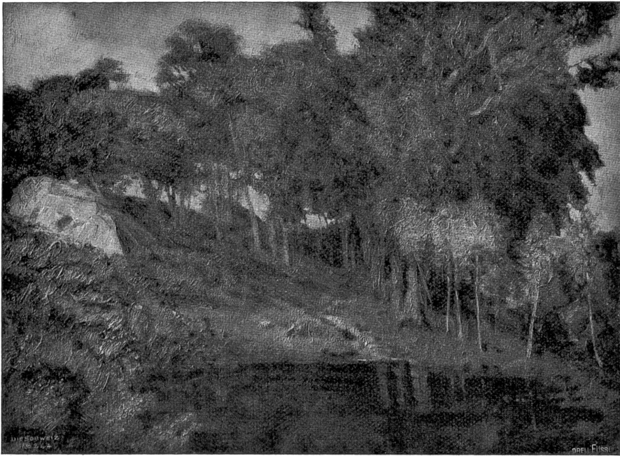
Abend. Nach dem Gemälde von Wilh. Ludwig Lehmann, Zürich-München.

die Photographie, die statt dessen zur Abbildung gelangt, sehr treu und lebendig fest.