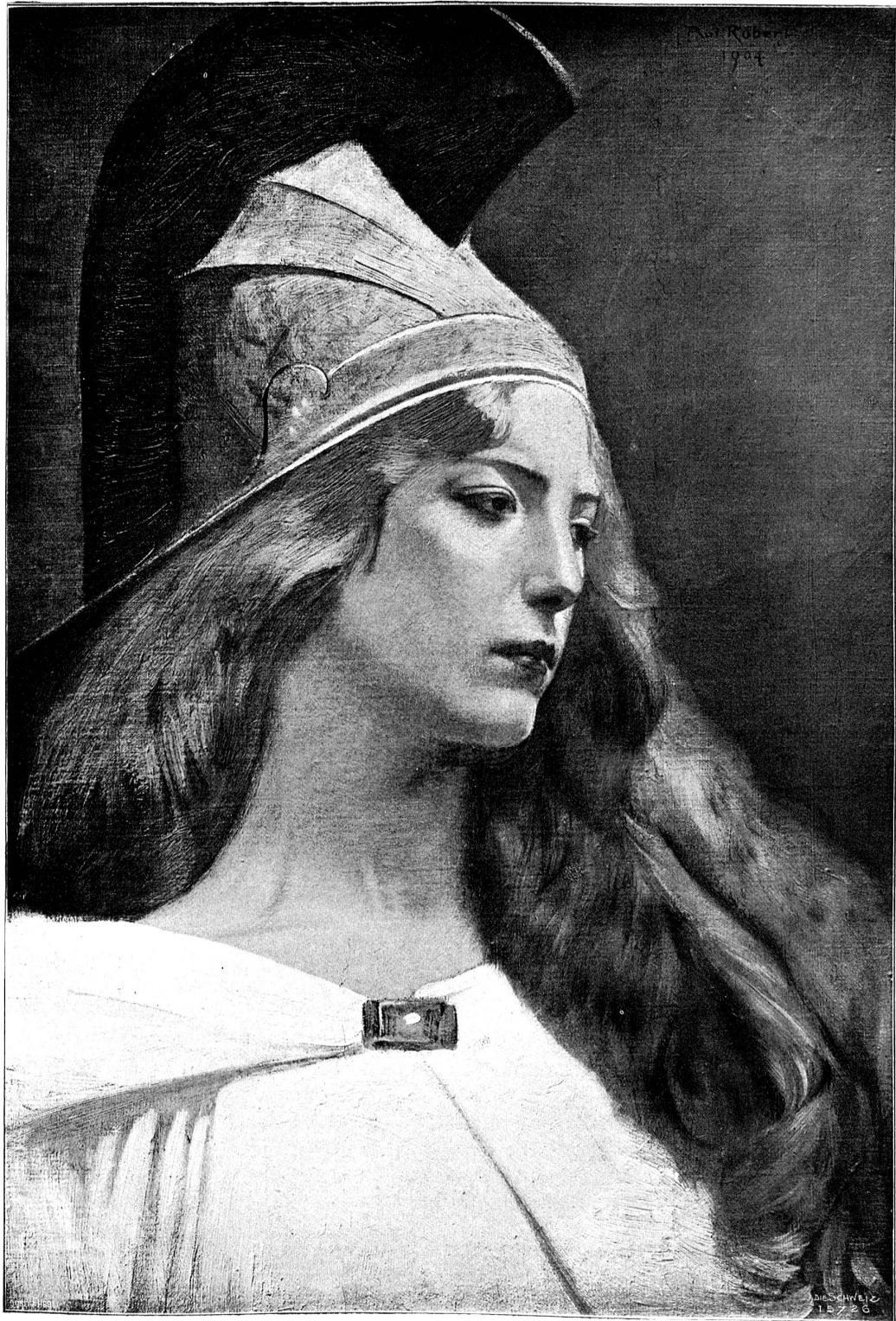
Studienkopf (zur Figur der „Gerechtigkeit“). Nach dem Gemälde von Paul Robert, Ried bei Biel.