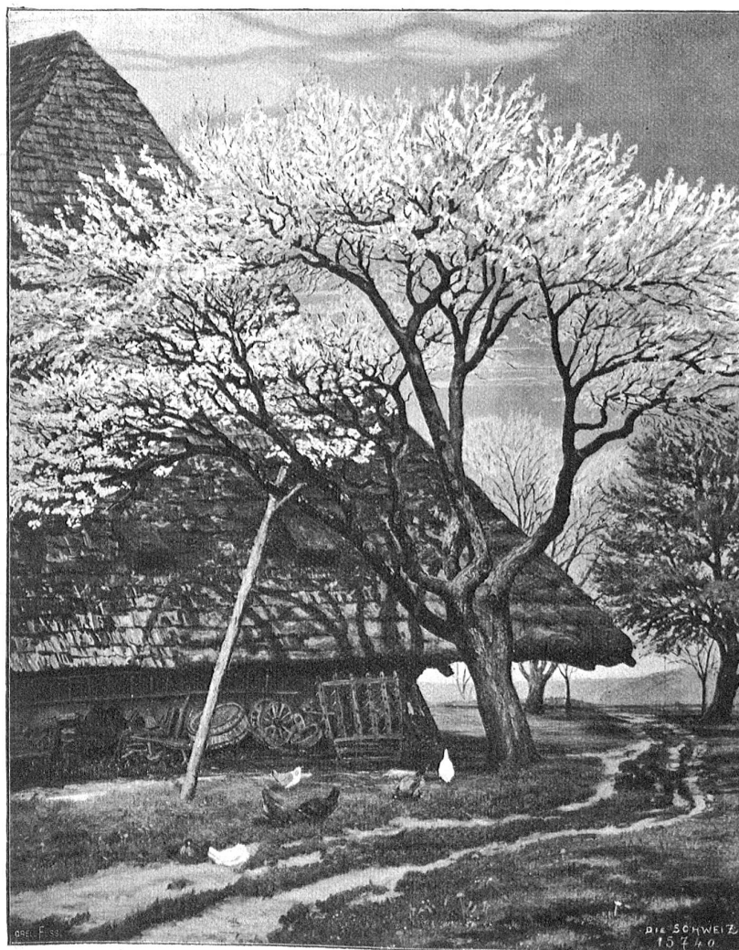
Blühender Apfelbaum. Nach dem Gemälde von Gottfried Herzig, Molenbach.

„Paul, Paul! Diese Stunde war die höchste Freude meines Lebens!“ rief sie und sank mir schluchzend an