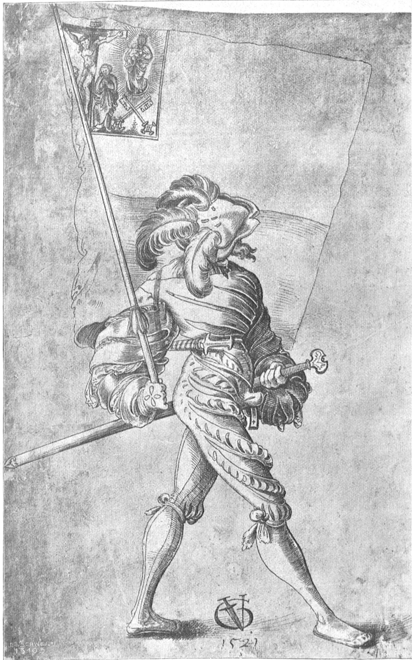
Landsknecht mit Fahne. Nach der Federzeichnung (1527) von Urs Graf (1480 geb. zu Solothurn), im Besitz der Gottfried Keller-Stiftung, deponiert in der Kupferstichsammlung des Eidg. Polytechnikums.

Aber ich hatte kaum die Moskitovorhänge meines Bettes sorgfältig ringsum unter die Matratze gehoben, um mir eine ungestörte Ruhe zu sichern, als ein entferntes Geschrei, aus dem ich deutlich das aufregende Wort „Amok!“ zu unterscheiden glaubte, mich mit einem Satz wieder aus dem Bette springen, den Revolver ergreifen und hinausheilen ließ.