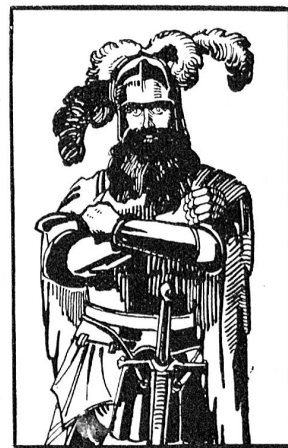
DIE SCHWEIZ 1527/8.

Da traf den Großen ein Blick voll Schmerz und Betrübniß aus des Freundes Auge, daß er den eigenen niederschlug. Er hatte in den Wochen vaterländischer Gefahr, die nun hinter ihm lagen, seinen Geist ganz auf Kampf und Sieg gerichtet und alles vergessen, was sein Mannesherz so leicht in Flammen der Leidenschaft auflodern ließ. Nun ward er plötzlich seines Vergehens inne und hatte ein um so stärkeres Gefühl seiner Schuld gegenüber dem Freunde, als dieser mit den Ratsherren und den Besten und Wägststen seiner Vaterstadt hinausgeißelt war, um seine Größe mitzufeiern, ja ihn eigentlich durch einen prunkhaften Triumphzug vor aller Welt zum Gegenstand der Verehrung zu machen. Denn es gibt für den Mann kein Erhebenderes, aber auch kein vernichtenderes Urteil als das des Freundes, mit dem man die Unschuld der Jugend verlegt hat. Sie ist der Spiegel, in dem sich Freunde immer wieder erkennen; Waldmann aber hatte ihn befleckt. Das abgewandte, nach innen gekehrte Auge Zur Silgens war wie gebrochen, und Waldmann wußte, daß ein Unheil geschehen war, das nicht mehr gut gemacht werden konnte. Dennoch wagte er den Versuch, legte den Arm um des Freundes Schulter, zog ihn auf die Seite und flüsterte ihm voll Bewegung zu: „Diethelm,