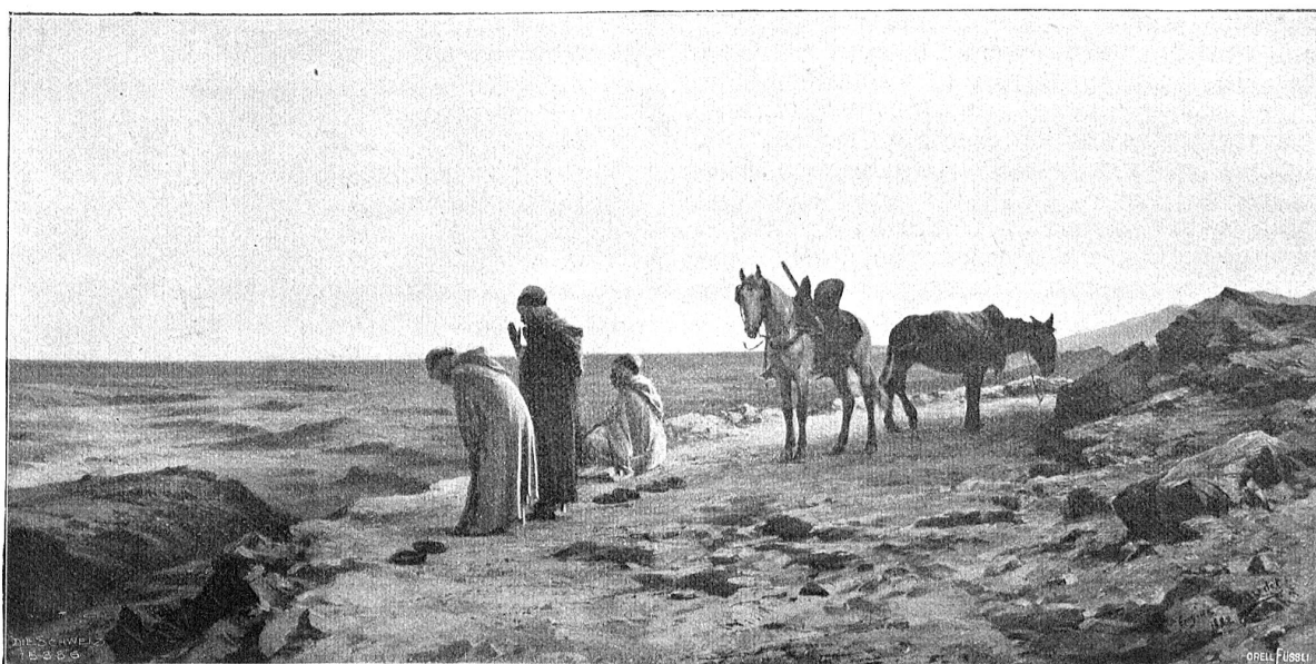
Araber im Gebet. Nach dem Gemälde (1852) von Eugène Girardet (Neuenburg-Paris) im Musée Rath zu Genf.