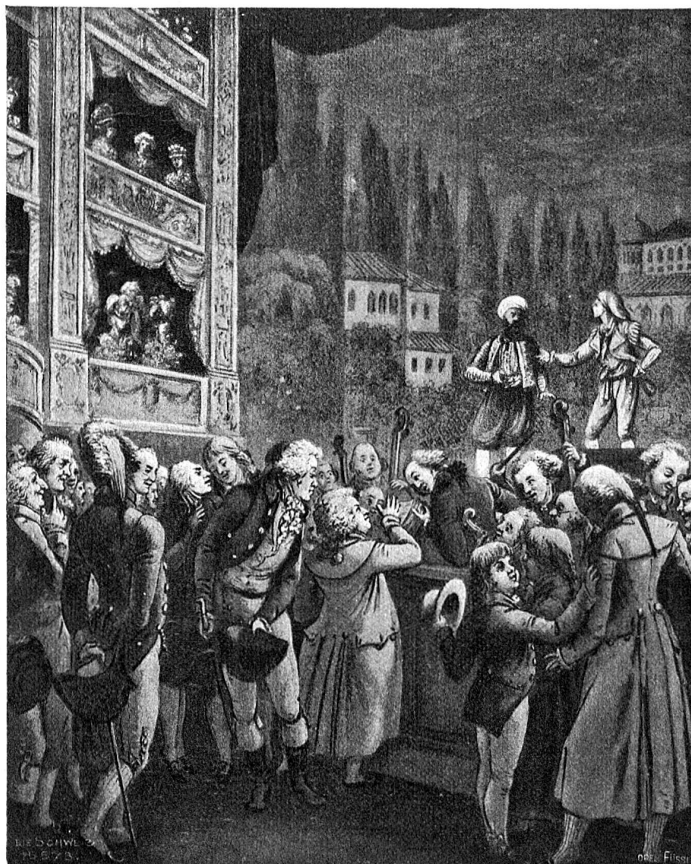
Mozart im Berliner Opernhaus bei Aufführung seiner Oper „Die Entführung aus dem Serail“. Nach dem Stich von Franz Hegi (1774–1850).

Dies nun waren so eigentlich meine Winterfreunden außer Hause. — Ich glaube dabei mehr gelernt als genossen zu haben. Gegenwärtig lese ich die theologischen Schriften Herbers und zwar alle Tage eine Stunde abends, welche mir durch diese Lektüre allemal zur schönsten Feierstunde wird, besonders seit ich seine Ideen über die Welterschaffung betrachte. Ich kann Dir nicht beschreiben, wie mich sein unschuldiger, einfacher Sinn, seine morgenländisch poetische Sprache, sein tiefes, frommes Gemüt, seine heilige Begeisterung für das Gute, Schöne, Wahre, mit einem Wort für die Gottheit und dabei seine seelenvoll leuchtende Klarheit, sein reiner, freisinniger, großer Glaube mit allmächtiger Kraft an sich fesselt. Und wenn ich mich frage, wer hat denn diesen Glauben, diese Menschentiebe, diese Gemüthlichkeit, Unschuld und Meinheit gehebt, was für ein Wesen in seiner Brust getragen, was für ein Wesen so gefühlt, gedacht, gestrebt und gesprochen, und ich sage mir, das Alles