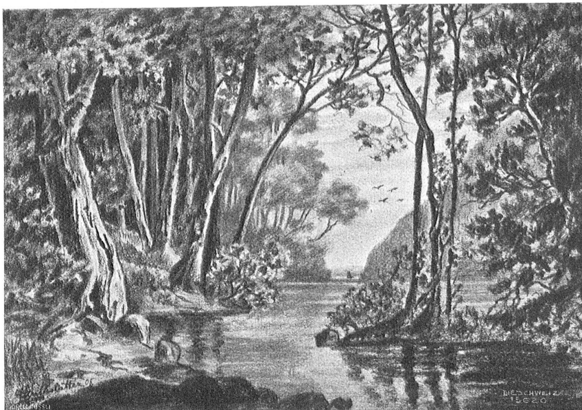
Waldidyll.

Eine Unschlüssigkeit malt sich in ihren Mienen. Zaudernd dreht sie ein Heft zwischen den Fingern; dann gibt sie sich einen Ruck, ein halbspöttisches Lächeln umkräuselt den Mund: „Du fürchtest dich wohl, Hedwig Mertens, wenn du außer der Zeit Geld holst?“