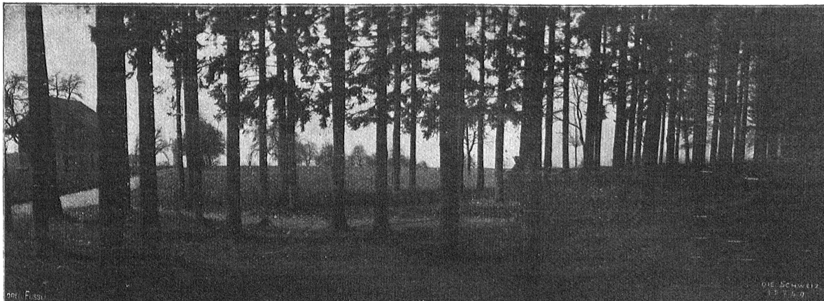
Auf dem Zürichberg.