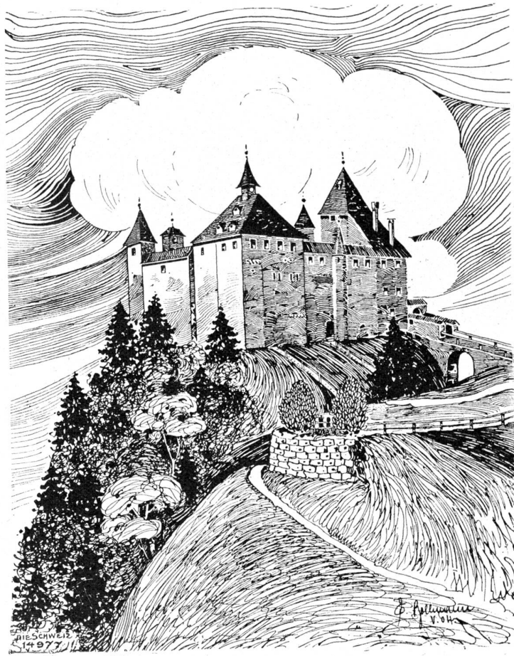
Schloß Kyburg. Nach Federzeichnung von Emil Bollmann, Kyburg.

Ja, da war das Kloster. Da waren die Arkaden mit dem holperigen Pflaster in den Wandelgängen und mitten drin der Friedhof. Es war da feucht und kühl und ganz still; man konnte gut denken dort. Dann war da die Kirche, mit dem großen Gottesbilde darin, das wunderkräftig war. Man hörte den dumpfen Gesang der Mönche. Die Weihrauchwolken stiegen. Der Duft des Weihrauches zog in grauen Schwaden durch alle Gänge. Es roch überall nach Weihrauch. Und mit den Weihrauchwolken zog schwermütig die feierliche Melodie der Gesänge. Dann verstummte der Gesang, die Kerzen erloschen, und nur der Weihrauchduft blieb. Auf den kalten Fliesen der Kirche lag der fromme Bruder Martin. Er rutschte auf dem Boden hin, murmelte, schlug sich die Brust und betete bis zur Ekstase. So bereitete er sich auf die ersehnten himmlischen Erscheinungen vor.