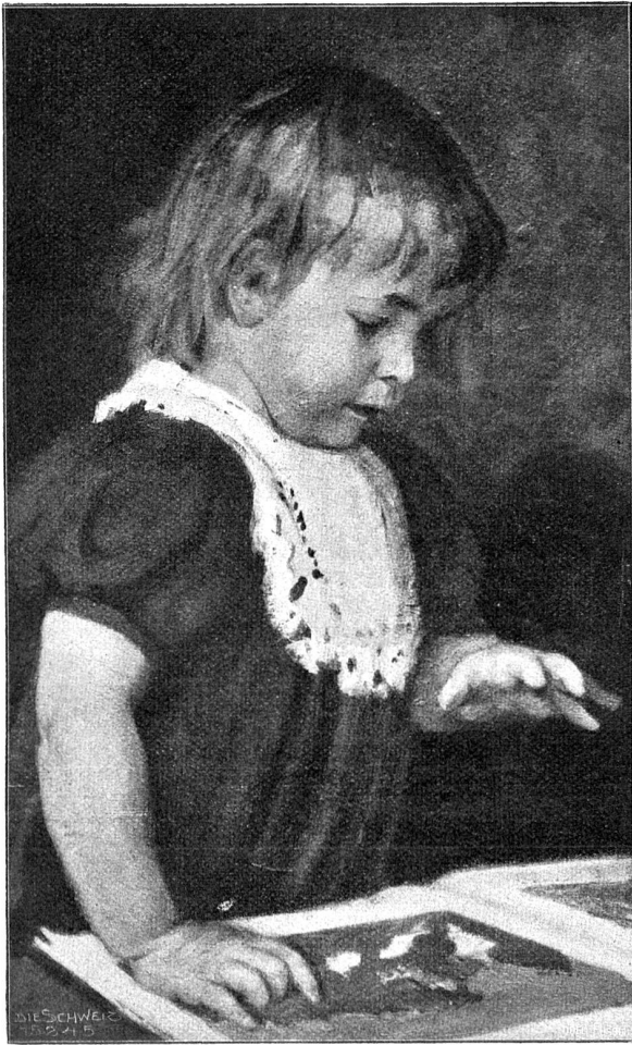
Kinderbildnis. Nach dem Gemälde von Wilhelm Walmer, Basel-Florenz.

vom Estrich herunter, schnürte sich die Gamaschen an, nahm das Geld vom Tisch und wollte sich davonmachen. Da sah er Blutflecken am Boden, die nicht völlig ausgewaschen werden konnten, und Ekel und Abscheu ergriff ihn.