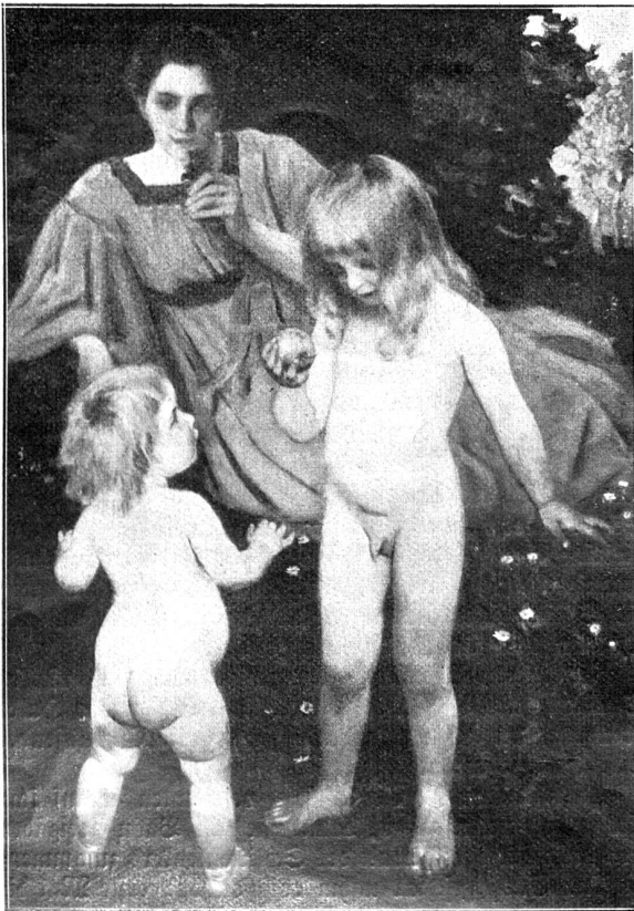
Studie. Nach dem Gemälde von Wilhelm Balmer, Basel-Florenz, im Kupfer nach zu Genf.