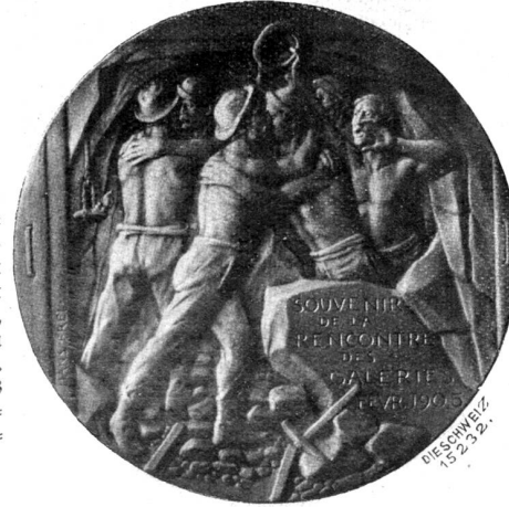
Rückseite der Simplonmedaille von Hans Frei, Basel.