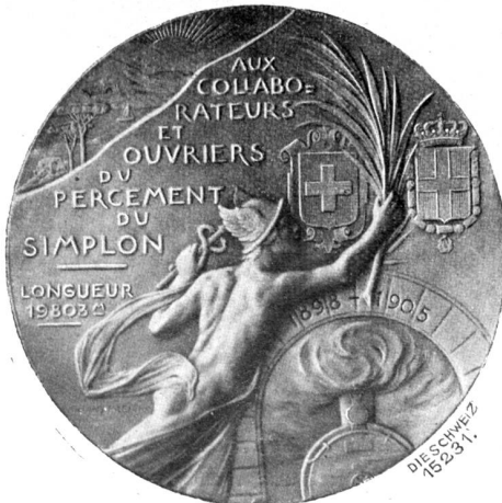
Vorderseite der Simplonmedaille von Hans Frei, Basel.