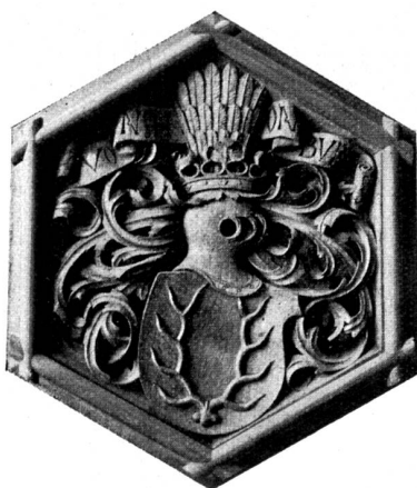
Medaillon von einer Holzdecke aus Schloß Arbon (St. Thurgau) im Schweiz. Landesmuseum zu Zürich.