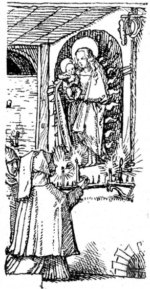
Hans Holbein d. J. Federzeichnung aus dem „Lob der Narrheit“ (Superstitionis cultus).

„Nein,“ sagt die Anna. Sie ist aufgestanden. Eine