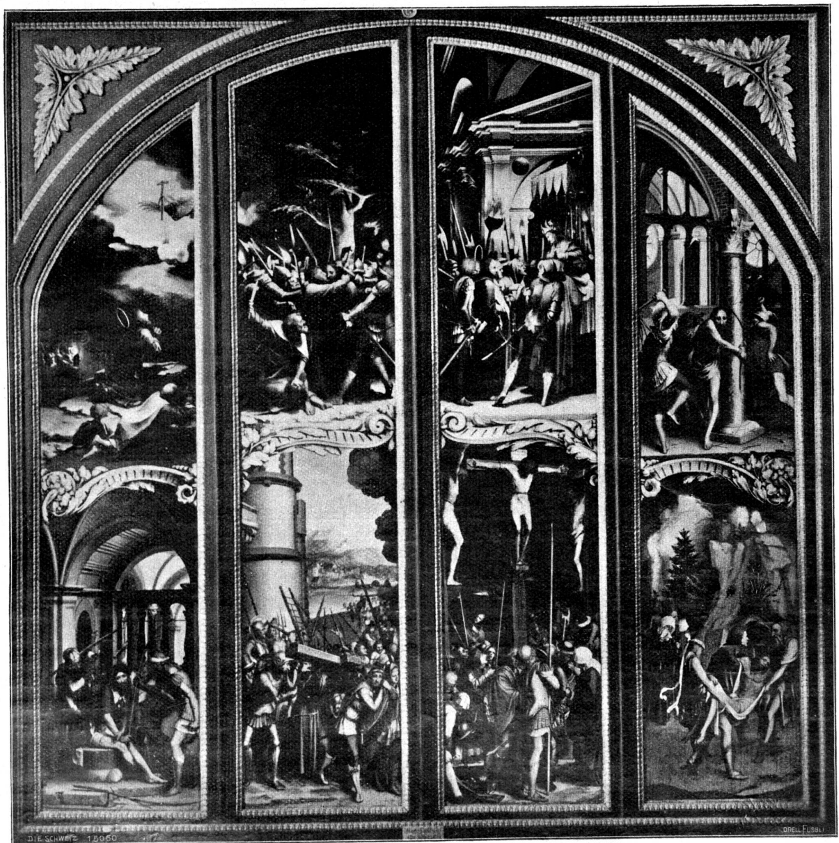
Hans Holbein d. J. Die Passion, Außenseiten der Flügel eines Altars, in der Öffentl. Kunstsammlung zu Basel.

„Tag,“ sagt er, „ich bin schon da; schnell fertig gewesen bin ich diesmal.“ Dann erblickt er die Anna, kommt in die Stube und setzt sich. Wohl oder übel muß auch die Anna noch bleiben. So sitzen die drei beieinander. Allemal, wenn ihnen heiß wird, weil es zu