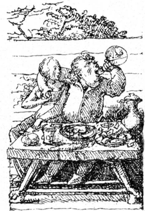
Hans Holbein d. J. Federzeichnung aus dem „Lob der Nartheit“ (De grege porcus).