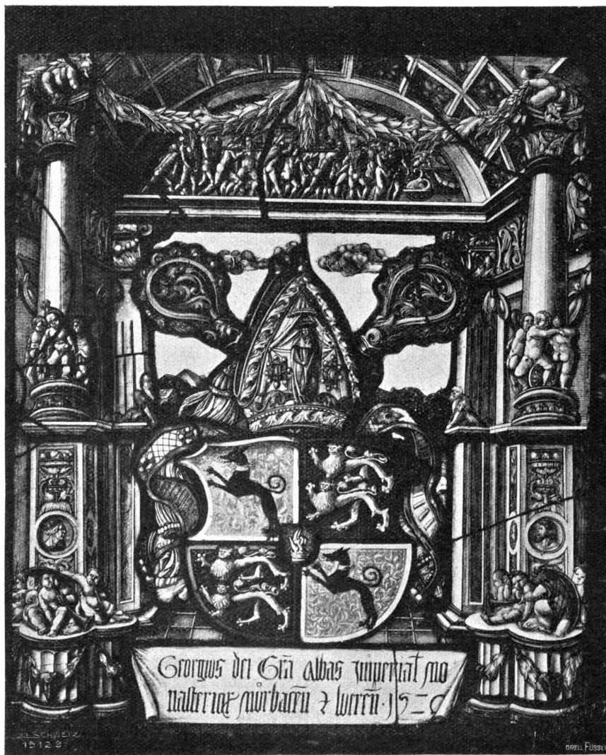
Hans Holbein d. J. Glasgemälde mit Wappen des Abtes von Murbach Georg von Maßmünster in Basler Privatbesitz.

„Ich habe kein Recht zum Unzufriedensein,“ gibt sie zurück, „muß dir danken, daß du mich behältst.“