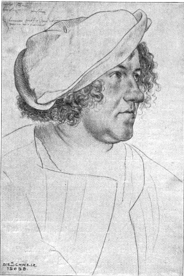
Hans Holbein d. J. Vorzeichnung zum Bildnis des Jakob Meyer z. „Fälschung“ in der öffentlichen Kunstsammlung zu Basel.