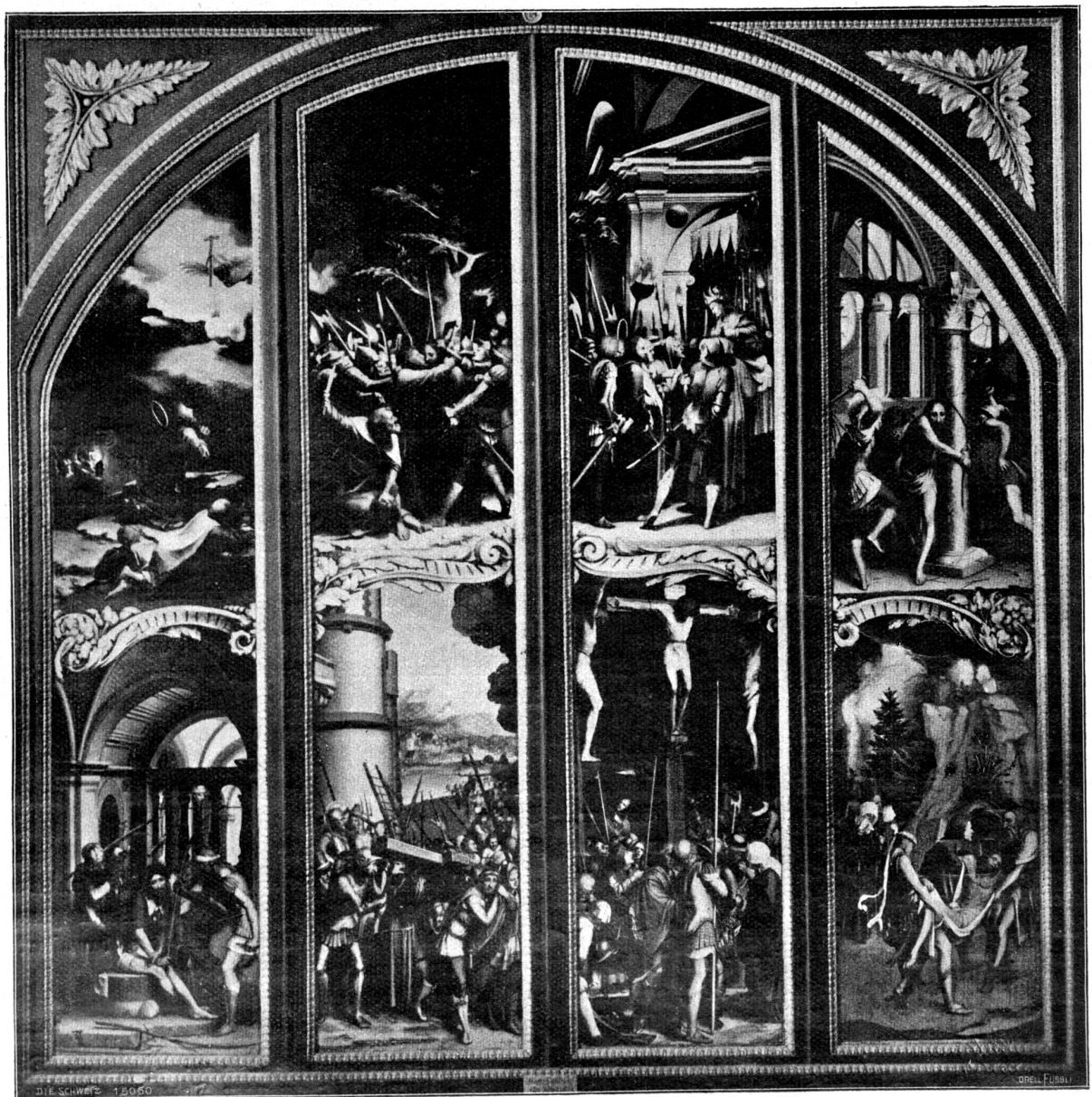
Hans Holbein d. J. Die Passion, Außenseiten der Flügel eines Altars, in der Öffentl. Kunstsammlung zu Basel.

„Tag,“ sagt er, „ich bin schon da; schnell fertig gewesen bin ich diesmal.“ Dann erblickt er die Anna, kommt in die Stube und setzt sich. Wohl oder übel muß auch die Anna noch bleiben. So sitzen die drei beieinander. Allemal, wenn ihnen heiß wird, weil es zu