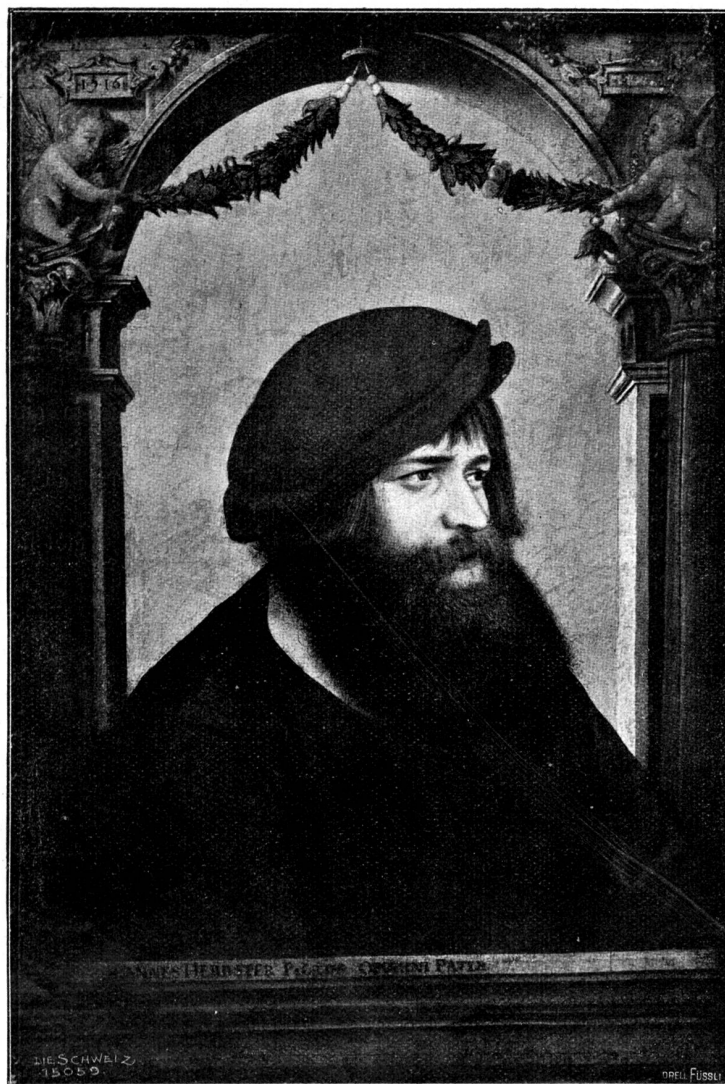
Ambrosius Holbein. Bildnis des Malers Hans Herbstler von Basel, im Besitz der Gottfried Keller-Stiftung, deponiert in der Doffentl. Kunstsammlung zu Basel.

„Nun, nun,“ beschwichtigt er gutmütig. Mit dem „Nun, nun“ läßt er das Gespräch zu Ende kommen; mehr ist heute nicht reif. Aber der Friede