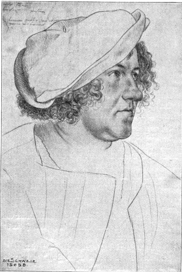
Hans Holbein d. J. Vorzeichnung zum Bildnis des Jakob Meyer z. „Basen“ in der öffentlichen Kunstsammlung zu Basel.