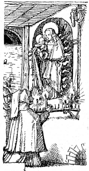
Hans Holbein d. J. Federzeichnung aus dem „Lob der Narrenheit“ (Superstitionis cultus).

„Nein,“ sagt die Anna. Sie ist aufgestanden. Eine