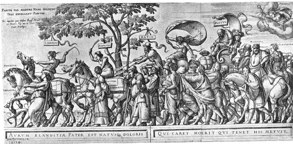
Hans Holbein d. J. Triumphzug des Reichtums. Nach einem Wandgemälde im Stadhof zu London.

still zwischen ihnen ist, weiß wieder eines etwas zu sagen. Aber die Unterhaltung ist eine mühsame Sache. Dennoch geht die Anna nicht, und der Vincenz sitzt wie angeleimt; denn — es ist etwas Großes, so in der gleichen Stube beieinander zu sitzen! Die Püntinerin stört sie nicht. Es ist, als ob sie nicht da wäre. Der Vincenz fühlt nur die Nähe von einer, und die fühlt nur, daß der Vincenz da ist. Endlich aber weiß die Anna, daß es Zeit ist zu gehen; die Püntinerin muß sonst merken, warum sie bleibt. So steht sie auf und gibt der Alten die Hand, muß sie auch dem Vincenz geben. Die Hände fallen zusammen und halten fest; es ist keine unschuldig; sie liegen beide knapp ineinander und lassen sich unwillig los.