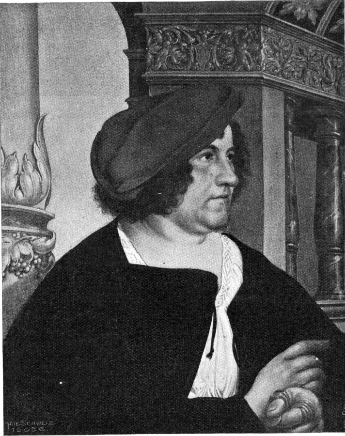
Hans Holbein d. J. Bildnis des Bürgermeisters von Basel Jakob Meyer z. „Säsen“ in der Dörschli-Kunstsammlung zu Basel.

Handarbeit liegt vor ihr auf dem Tisch, wo sie gegessen hat; im ersten Schreck hat sie sie hingeworfen. Das Herz schlägt ihr, daß sie es oben am Hals fühlen kann. Was der will, der Vincenz?!