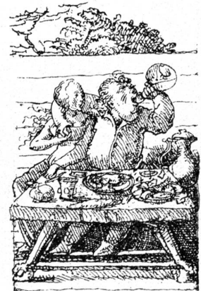
Hans Holbein d. J. Federzeichnung aus dem „Lob der Nartheit“ (De grege porcus).

Der Felice und der Arnold treten dicht hintereinander ein. Sie sind im Gespräch begriffen auf die Schwelle getreten; so sieht