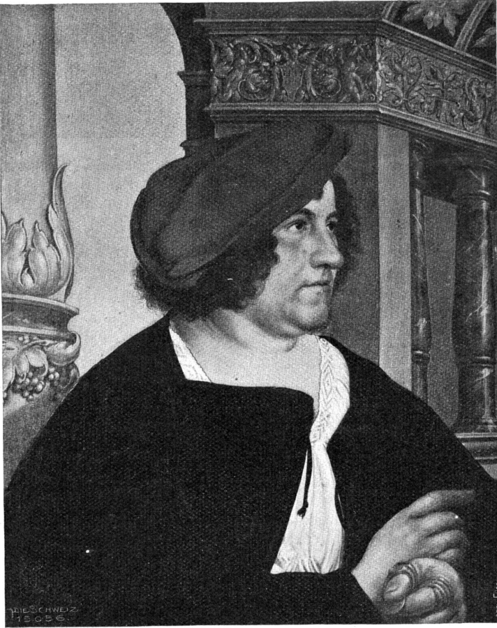
Hans Holbein d. J. Bildnis des Bürgermeisters von Basel Jakob Meyer z. „Safen“ in der Doffentl. Kunstsammlung zu Basel.