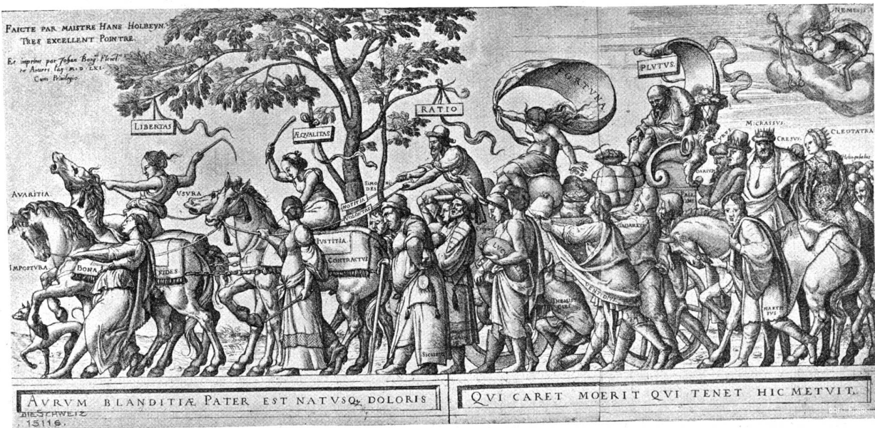
Hans Holbein d. J. Triumphzug des Reichtums. Nach einem Wandgemälde im Stadhof zu London.

still zwischen ihnen ist, weiß wieder eines etwas zu sagen. Aber die Unterhaltung ist eine mühsame Sache. Dennoch geht die Anna nicht, und der Vincenz sitzt wie angeleimt; denn — es ist etwas Großes, so in der gleichen Stube beieinander zu sitzen! Die Püntinerin stört sie nicht. Es ist, als ob sie nicht da wäre. Der Vincenz fühlt nur die Nähe von einer, und die fühlt nur, daß der Vincenz da ist. Endlich aber weiß die Anna, daß es Zeit ist zu gehen; die Püntinerin muß sonst merken, warum sie bleibt. So steht sie auf und gibt der Alten die Hand, muß sie auch dem Vincenz geben. Die Hände fallen zusammen und halten fest; es ist keine unschuldig; sie liegen beide knapp ineinander und lassen sich unwillig los.