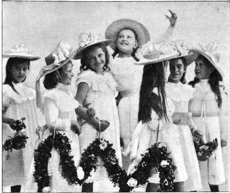
Vom St. Galler „Kinderfest“ (Phot. Schöbinger & Sandherr, St. Gallen).

„Nein,“ sagte dieser ruhig. „Aber . . . aber ich kann nicht stehen; der rechte Fuß muß verstaucht sein.“