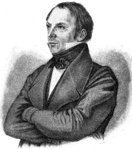
Joseph Greith (1798—1869).

„Wem soll ich's geben Zu Freude seinem Leben?“