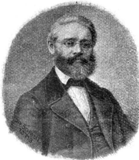
Wilhelm Baumgartner (1820–1867), „D mein Heimatland“, „Noch sind die Tage der Rosen“ etc.).