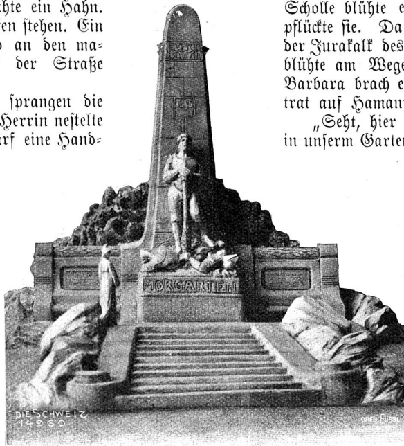
Morgartendenkmal. Entwurf von Franz Wanger, Zürich-München.