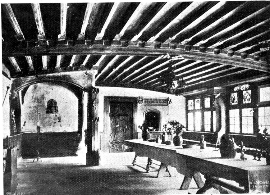
St. Georgen-Kloster zu Stein a. Rh. Refektorium des Abtes Johannes I. aus dem Jahr 1444.