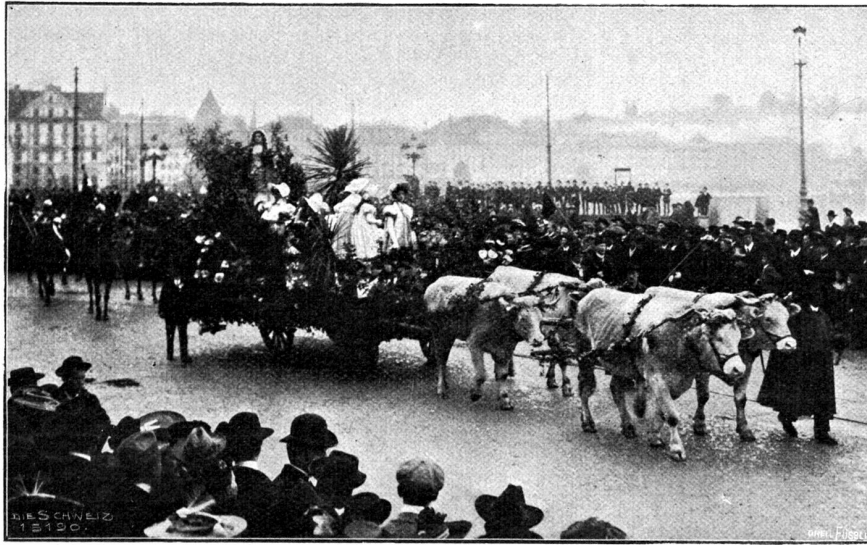
Fritschzug in Luzern. Das Mädchen aus der Fremde.

auch eine gewisse Milde spricht aus den Zügen der Bauersfrau. Ihre Gedanken sind gesammelt; sie, die schon manches, auch Schweres erfahren hat, schreitet bescheiden, doch aufrecht und mit Festigkeit einher. Sie scheint uns der bedeutendere Teil dieses Ehepaars zu sein; denn der Mann flöht uns durch seinen Gesichtsausdruck und durch seine Haltung nicht in gleichem Maße Respekt ein. — Es ist sehr zu bedauern, daß dieses Bild nicht farbig reproduziert werden konnte — was übrigens keine leichte Sache gewesen wäre — denn der Künstler hatte sich die Auf-