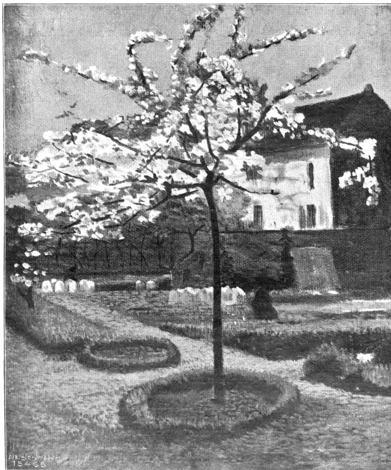
Frühling im Klostergarten. Nach dem Gemälde von Carl Montag, Winterthur-Paris.

Schlags drei Uhr klopfte ich an seine Türe und trat auf ein weiches „Herein" mit klopfendem Herzen in den kleinen Raum: ein starker Duft von Eau de Botot, eine hohe braune Staffelei, ein Meer von Photographien, Zeich-