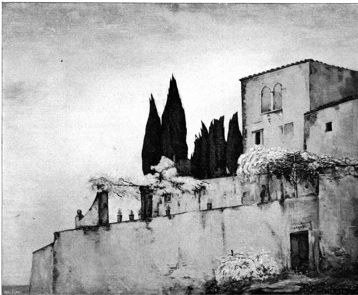
Italienische Villa. Nach dem Gemälde von Gustav Camper, Zürich.