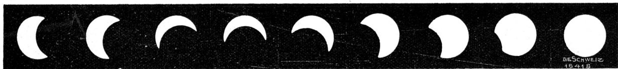
151 153 213 220 235 255 307 323 330 Die Sonnenfinsternis vom 30. August in verschiedenen Phasen mit Zeitangabe der Aufnahmen.