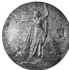
Der sog. „Schützenaler“ (Revers).