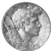
Goldene Medaille (A.).

gemacht. Die Festhütte haben wir in ihrer Bauweise bereits am eidgenössischen Turnfest in Zürich letztes Jahr kennen gelernt; neu daran ist einzig die künstlerisch ausgeschmückte Hauptfassade. Wenn sie in St. Gallen so vielen Schutz gewährte gegen die Glut der Sonnenstrahlen wie in Zürich vor dem unaufhörlich rieselnden Naß, so dürften die St. Galler mit Festwetter und