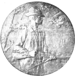
Der sog. „Schützenaler“ (Avers).

Es stieg ein kurzer, klager Laut von der Wiege hinter dem schlafenden Manne auf.