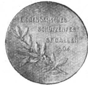
Goldene Medaille (A.).