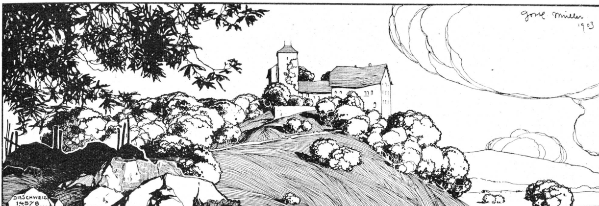
Schloss Wildenstein an der Aare bei Wildegg. Nach Federzeichnung von Gottlieb Müller (Nargau), Paris