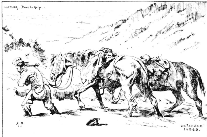
Pferde im Schnee. Nach Zeichnung von Aug. Bachelin (1830—1890).

wurden an den Grenzen angesammelt. Unsere schweizerischen Soldaten benahmen sich dabei recht gut und erzeugten auch den Franzosen gegenüber viel Menschenfreundlichkeit. Unsere Bilder der Maler Aug.