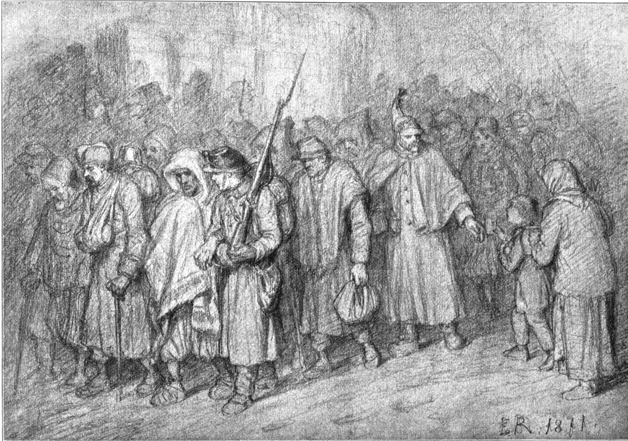
Ueberreste der Bourbaki-Armee bei ihrer Ankunft in St. Gallen. Nach einer Originalzeichnung von Emil Rittmeyer (geb. 1820) im Museum zu St. Gallen.

Baden, Freiburg, St. Gallen, Interlaken, Luzern und Zürich, in welchen Plätzen sie in den vielen Gasthöfen Quartier fanden. Die Mannschaft dagegen wurde in den Städten, großen Dörfern und andern geeigneten Plätzen in geräumige Bereitschaftslokale untergebracht. Für die Reinlichkeit der Soldaten wurde nun das Möglichste getan, ebenso für die Ausbesserung der Kleidung. Die französische Regierung sandte einen reichen Vorrat von Kleidungsstücken jeder Art, der an diejenigen, die am meisten bedürftig waren, verteilt wurde. An einigen Orten wurden Lesefäle mit französischen Büchern und Zeitungen eingerichtet, und, wo es anging, konnten die französischen Soldaten bei den Bürgern gegen Lohn Arbeit, zu der sie ihrem Beruf nach taugten, verrichten. Ein eigenes Nachrichtenbureau wurde in Bern unter Leitung des Stabsmajors Davall eingerichtet. Weitere fünf schweizerische Offiziere und bald auch bis auf sechs- und vierzig französische Unteroffiziere waren darin tätig. Es handelte sich darum, all den französischen Familien, die nach ihren Söhnen fragten, deren richtige Adressen aufzugeben, auch ankommende Briefe genau zu adressieren. Es kamen nämlich jetzt massenhaft Briefe, Pakete und Geldsendungen, die schon lange nicht hatten bestellt werden können, aus Frankreich an; zwei Tage nach Eröffnung des Bureaus trafen von Dijon mehr als 200,000 Briefe in zehn großen Säcken ein, nachher andere Ballen aus