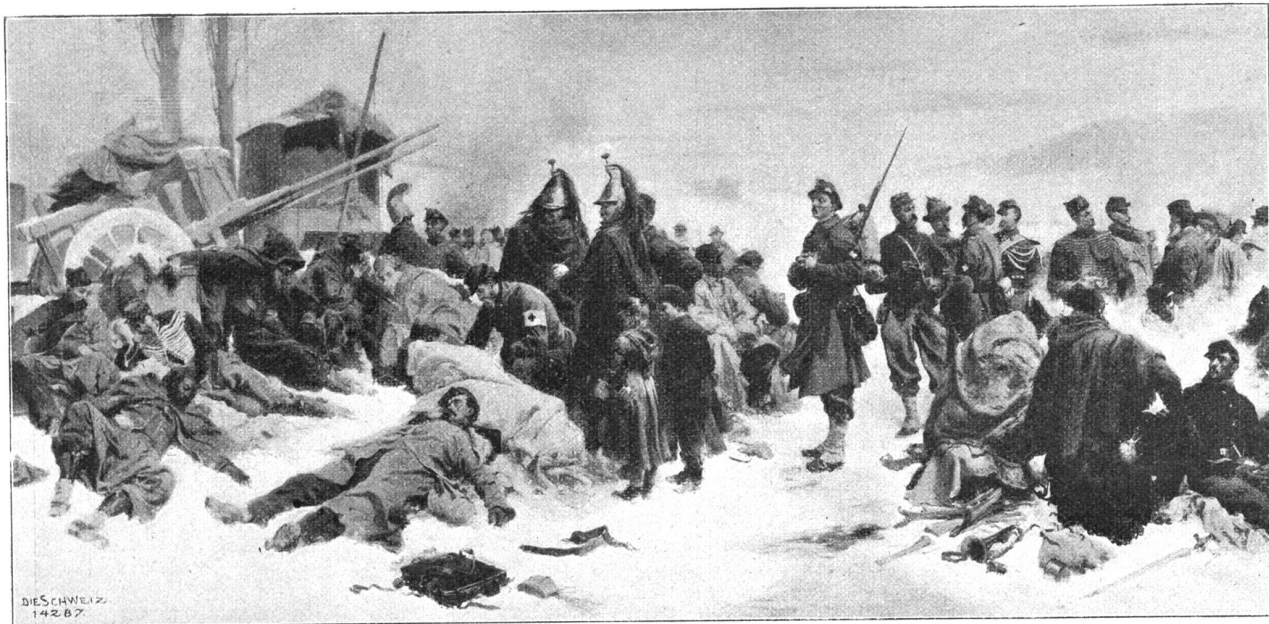
Die Bourbaki-Armee in Verrières. Nach dem Gemälde von Eug. Bachelin (1830—1890) im Museum zu Neuenburg.

möglichen Systemen vorhanden, für die auch die Schießmunition eine verschiedene sein mußte; da geschah es denn etwa, daß einzelne Truppenteile Patronen erhielten, die sie nicht brauchen konnten. Schuhe stunden genug zur Verfügung; doch war ein großer Teil zu eng. Viele Soldaten schnitten später die Schuhspitzen ab, damit sie in den engen Schuhen gleichwohl marschieren können. Dieses Aushilfsmittel mußte sich aber in der Folge im Winterfeldzug als ein verhängnisvolles erweisen. Ähnlich war es auch mit der Verpflegung und dem Transportwesen; an Geld zur Anschaffung des Nötigen fehlte es nicht; aber es mußte alles überstürzt werden, und als es dann mit der Expedition schlecht ging, ließen die getroffenen Anordnungen die Armee erst recht im Stich.