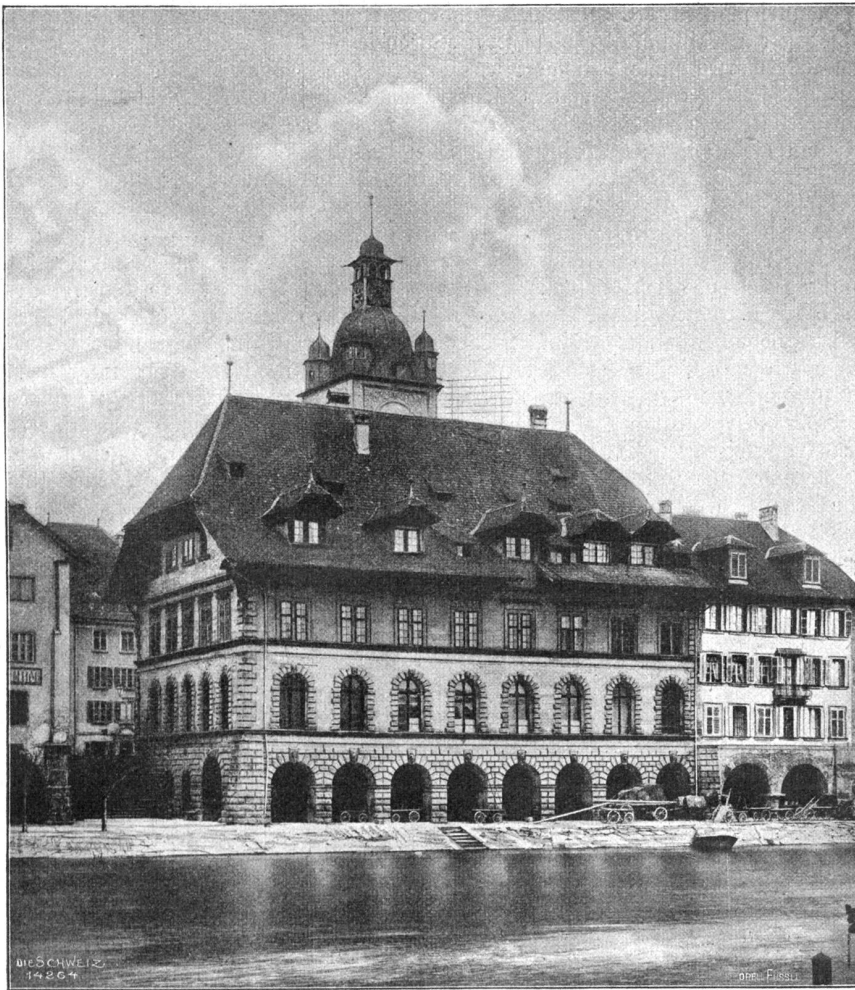
Rathaus in Luzern. Südfrent.

sich das Paar für einige Tage trennen sollte. Da man noch im Ungewissen war, ob, wie die franzosenfreundlichen Sanguiniker behaupteten, ein Hauptschlag zwischen Belfort und Basel erfolgen sollte, oder ob, nach der Befürchtung solcher, die ebenfalls Franzosenfreunde waren, die aber an jedem noch zu hoffenden Erfolg verzweifeln, eine Entscheidung näher bei Besançon zu erwarten war, hielt es Nestel für zweckmäßig, seinen jüngern Kollegen nach dem weniger gefährdeten Punkt zu instruieren, während er sich selbst den zweiten vorbehielt; in spätestens acht Tagen sollte man bei einem Straßenknotenpunkt in einem ganz bestimmten Gasthof zusammentreffen. Dieser Plan hatte noch den geheimen Zweck, daß Niemer genötigt war, in schwieriger Zeit einmal nach eigener Einsicht zu manövrieren und daß er sich Rechenschaft ablegen konnte von den Pflichten, die er in seinem zukünftigen Beruf zu übernehmen gesonnen war.