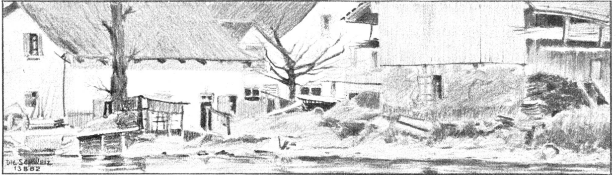
Kardmeyer, 1901 Vom Zürichsee bei Münstnacht.

Nachdruck verboten. Alle Rechte vorbehalten.