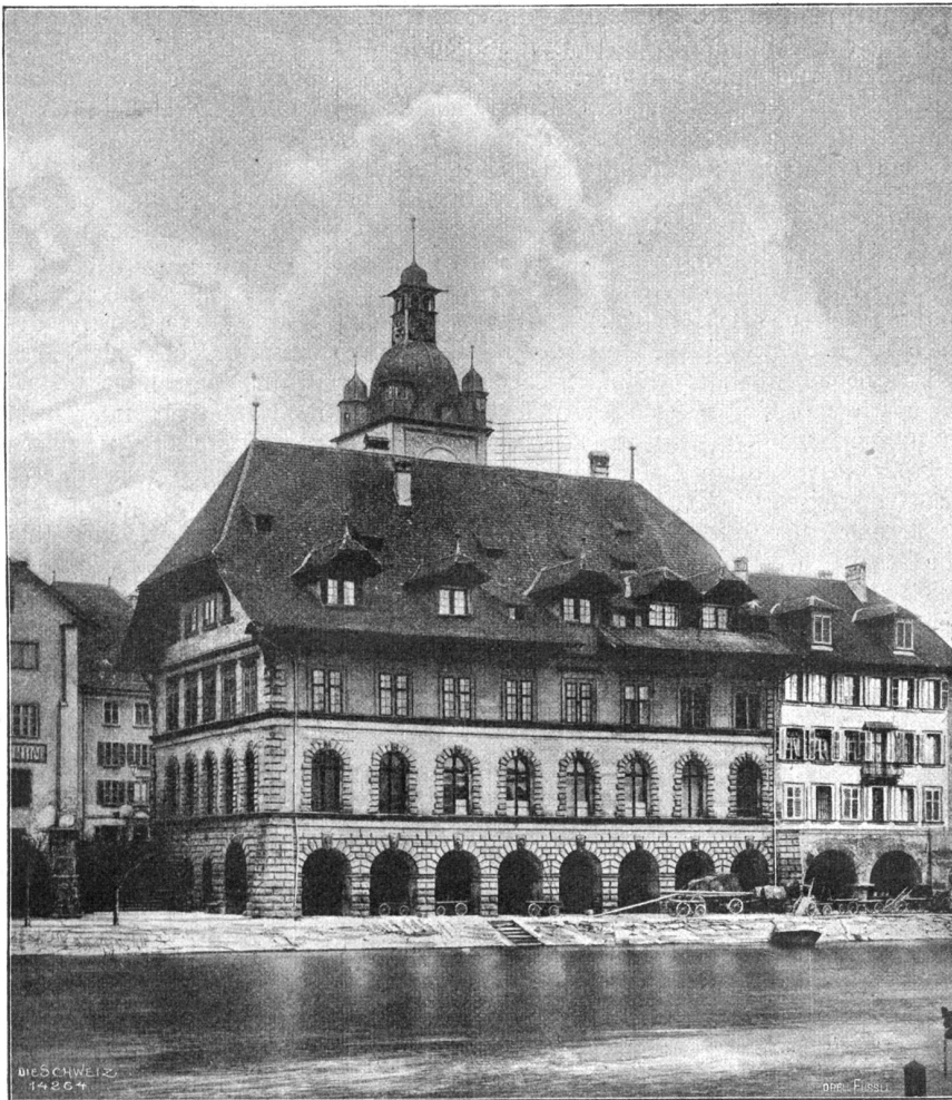
Rathaus in Luzern. Südfrent.

sich das Paar für einige Tage trennen sollte. Da man noch im Ungewissen war, ob, wie die franzosenfreundlichen Sanguiniker behaupteten, ein Hauptschlag zwischen Belfort und Basel erfolgen sollte, oder ob, nach der Befürchtung solcher, die ebenfalls Franzosenfreunde waren, die aber an jedem noch zu hoffenden Erfolg verzweifelten, eine Entscheidung näher bei Besançon zu erwarten war, hielt es Nestel für zweckmäßig, seinen jüngern Kollegen nach dem weniger gefährdeten Punkt zu instruieren, während er sich selbst den zweiten vorbehielt; in spätestens acht Tagen sollte man bei einem Straßenknotenpunkt in einem ganz bestimmten Gasthof zusammentreffen. Dieser Plan hatte noch den geheimen Zweck, daß Niemer genötigt war, in schwieriger Zeit einmal nach eigener Einsicht zu manövrieren und daß er sich Rechenschaft ablegen konnte von den Pflichten, die er in seinem zukünftigen Beruf zu übernehmen gesonnen war.