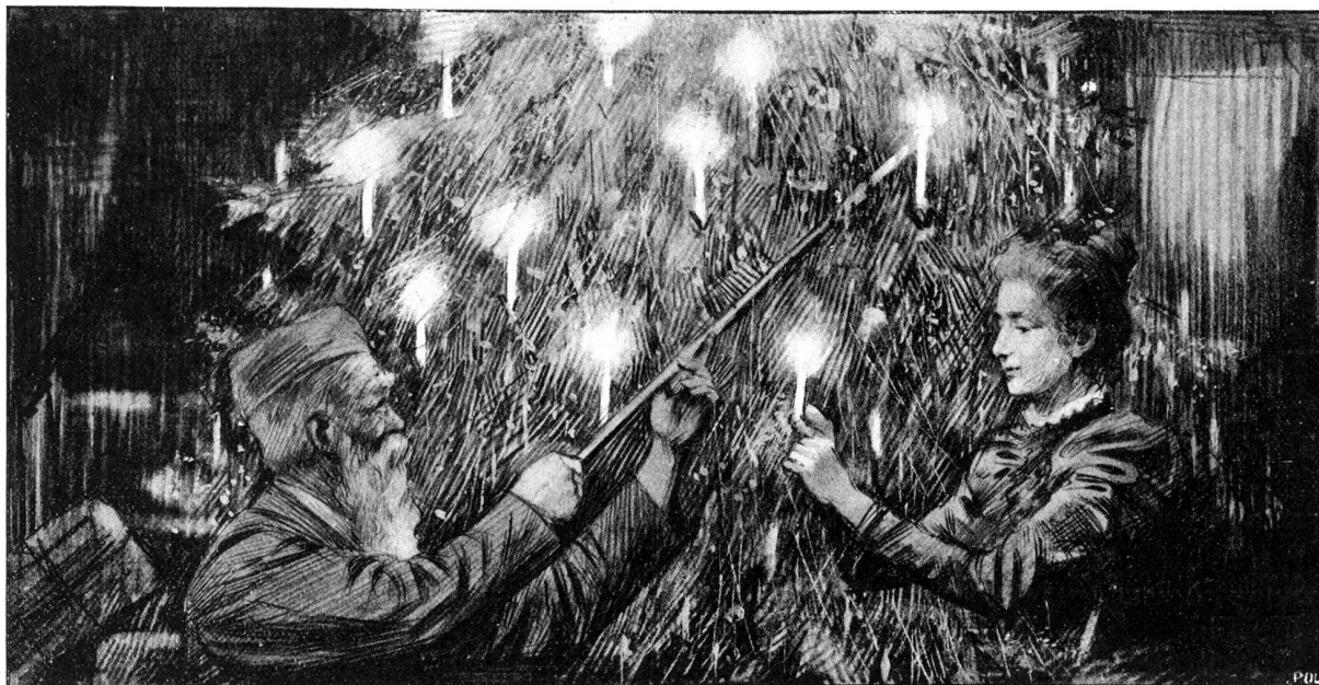
Weihnachten! Nach Originalzeichnung von Hans Meyer-Cassel.