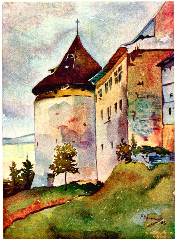
Pruntrut. Fürstbischöfliches Schloß. Nach Aquarell von B. Bannwart, Pruntrut.

Als der Tag anbrach, schloß Ingolf einen Augenblick.