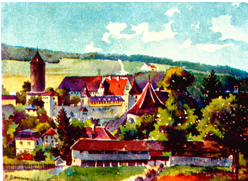
Pruntrut. Ansicht vom alten Schützenstand aus; im Hintergrund das fürstlich-schöne Schloß. Nach Aquarell von R. Bannwart, Pruntrut.

„Ich möchte es den ‚Gofen‘ schon gönnen; sie hätten's wahrlich bei der Madame besser. Keines hat nur ein rechtes