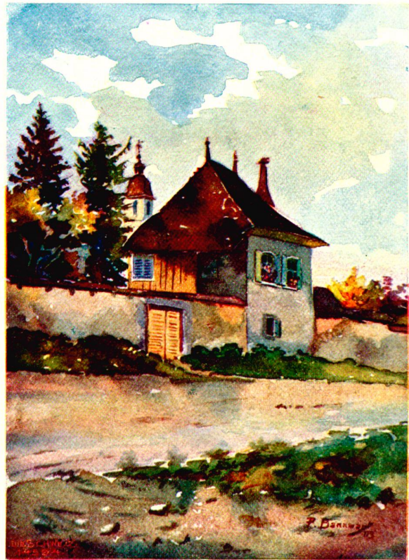
Partie aus Pruntrut («La Schliff».) Nach Aquarell von B. Bannwart, Pruntrut.

„Warum, wenn ich fragen darf?“ forschte Frau von Hagen, die an den bildhübschen Buben mit den blauen Augen Gefallen fand.