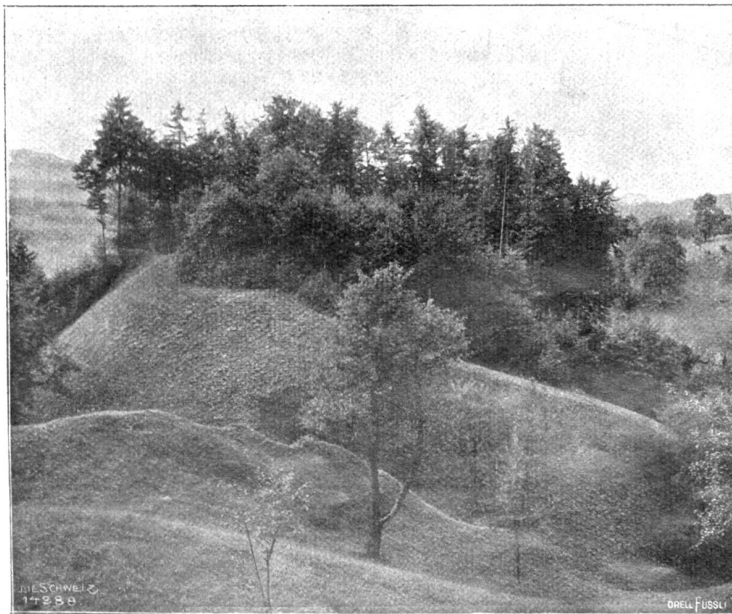
Burghügel der sog. „Geßlerburg“ ob Rüßnacht.

Der Stoß verpflanzte sich durch seine Schultern und Alexanders Körper bis hinauf zu In-