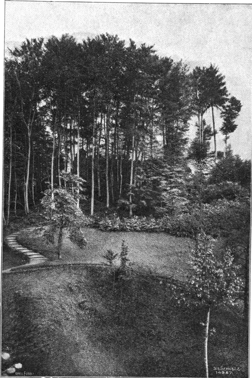
Ueberreste der sog. „Geßlerburg“ ob Rüßnacht.

Diesmal hatte sich Jngolf hintenübergeworfen, den Körper fast ausgestreckt haltend. Er fiel, das Gesicht der Manege zugekehrt, mit einer starken Schwenkung des Rückens, mit den Fußspitzen nach der Kuppel des Zirkus gerichtet. In einem blitzschnellen Moment sah er den Blick in den wachamen Augen Hugos und seine erhobenen Hände. Unwillkürlich zog er die Füße an sich — den Zehntel einer Sekunde zu spät; aber Hugo hatte sich beugend gebückt und ihn im letzten Augenblick doch noch ergriffen. Einen Augenblick schwankte der Knabe, suchte eifrig trippelnd nach einem festen Standpunkt, fand ihn nur mit dem einen Fuß, glitt und blieb hängen. Er saß reitend auf der einen Schulter Hugos.