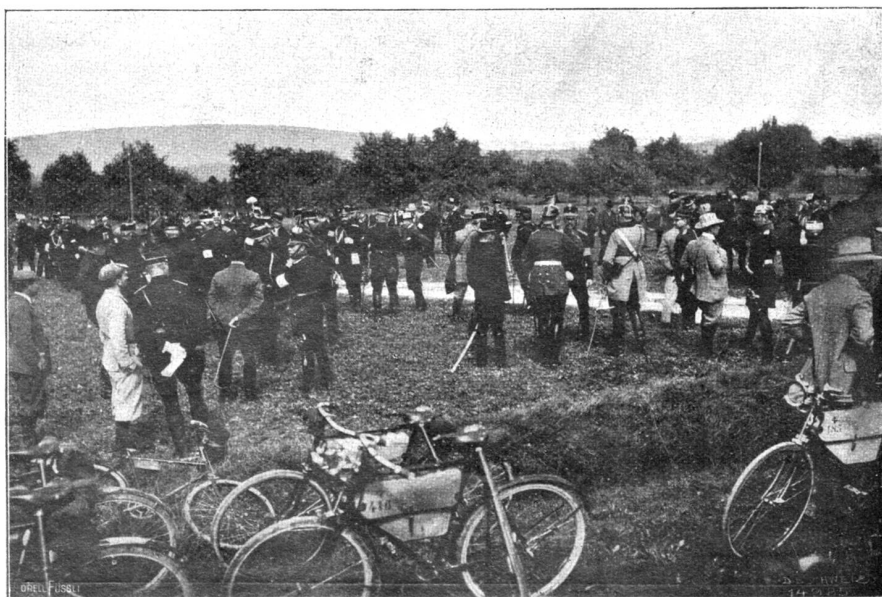
Manöver 1904. Die fremden Offiziere vor der Kritik.

Wenn ein bekannter Monarch auf die Kunst seines Landes persönlichen Einfluß üben und so die großen Mäcene der Renaissance kopieren will, vergißt er etwas sehr Wichtiges, nämlich, daß jene das Gottesgnadentum des Künstlers über das ihre setzten, daß sie den Herrscher vergaßen und nur insofern ein Anrecht auf den Meister zu haben glaubten, als sie selbst künstlerische Menschen waren.