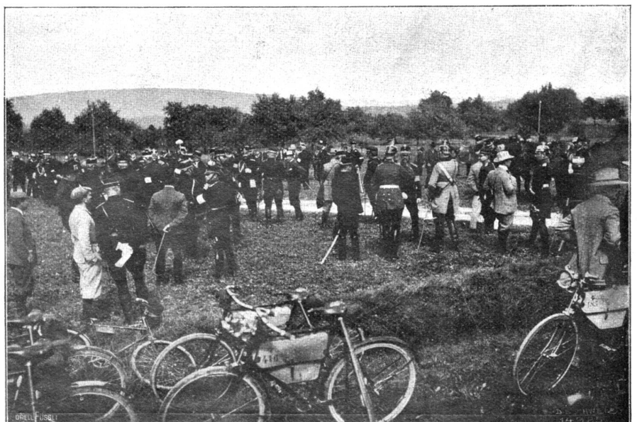
Manöver 1904. Die fremden Offiziere vor der Kritik.

Wenn ein bekannter Monarch auf die Kunst seines Landes persönlichen Einfluß üben und so die großen Mäcene der Renaissance kopieren will, vergißt er etwas sehr Wichtiges, nämlich, daß jene das Gottesgnadentum des Künstlers über das ihre setzten, daß sie den Herrscher vergaßen und nur insofern ein Unrecht auf den Meister zu haben glaubten, als sie selbst künstlerische Menschen waren.