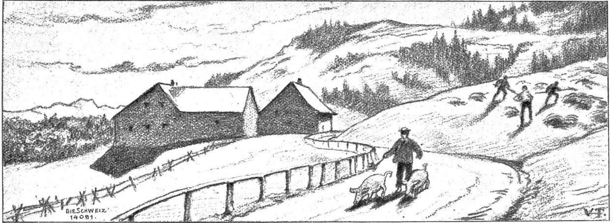
Im Sommer (Partie im „Ruppen“).