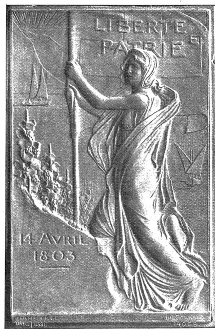
Plakette zur waadtländischen Jahrhundertfeier (Vorderseite).