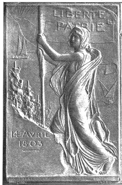
Plakette zur waadtländischen Jahrhundertfeier (Vorderseite).