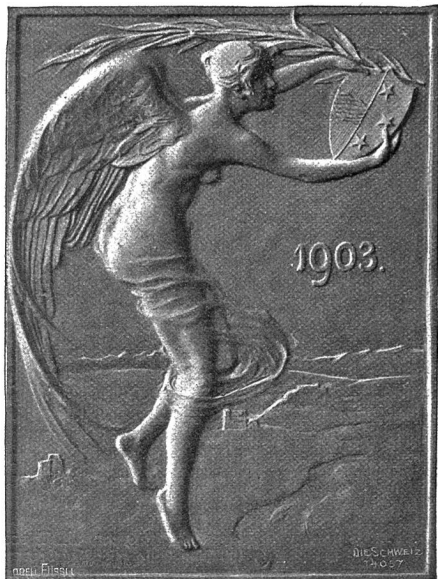
Plakette zur aargauischen Jahrhundertfeier (Rückseite).

gestalteten Kopfe getrenntlich wieder, und auch die übrigen Figuren im Vordergrund haben ganz individuelle Züge. Wir sehen Stapfer, wie er, soeben aus Paris zurückkehrend, den Beratern des Aargau die wichtige Urkunde überreicht. Ohne Jubel, ohne Begeisterung, mit Würde und Gelassenheit nehmen die Beschenkten die Gabe entgegen, entsprechend der Stimmung jener Zeit. Die