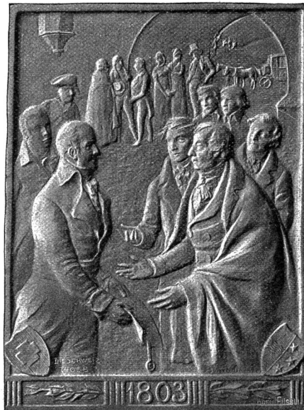
Plakette zur aargauischen Jahrhundertfeier (Vorderseite).