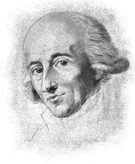
Johann Gottfried Herder.

ganz ähnliche Haltung und Züge zeigt, die letztern freilich etwas gröber und wohl auch noch etwas jünger. Bury aber hat seine Kreidezeichnung im Jahr 1800 gefertigt während eines längern Aufenthaltes in Weimar. Nach 1800 also, sagen wir direkt in Herders Todesjahr 1803 dürfte unsere Zeichnung entstanden sein und zwar, können wir beifügen, in