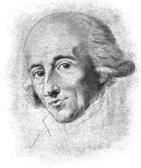
Johann Gottfried Herder.

ganz ähnliche Haltung und Züge zeigt, die letztern freilich etwas gröber und wohl auch noch etwas jünger. Bury aber hat seine Kreidezeichnung im Jahr 1800 gefertigt während eines längern Aufenthaltes in Weimar. Nach 1800 also, sagen wir direkt in Herders Todesjahr 1803 dürfte unsere Zeichnung entstanden sein und zwar, können wir beifügen, in