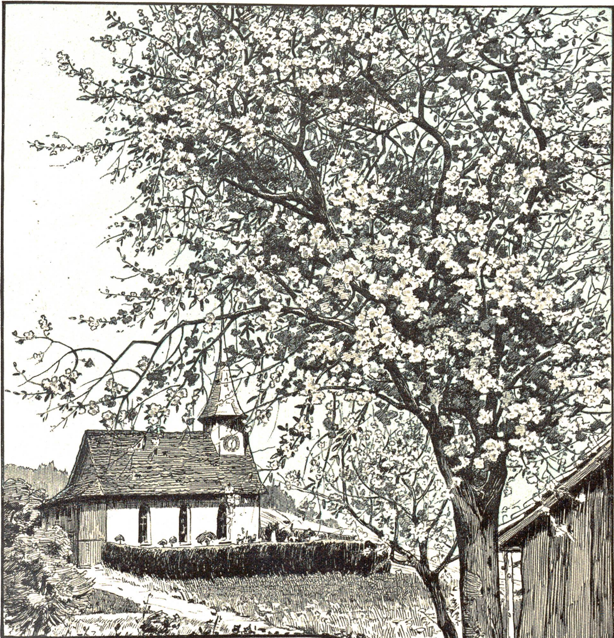
Kirchlein von Sternenberg (St. Zürich). Nach Federzeichnung von Ernst Tobler, Zürich = Darmstadt.

wahr sprach; Charles hatte sich sechs Jahre früher in Plymouth mit ihr trauen lassen."