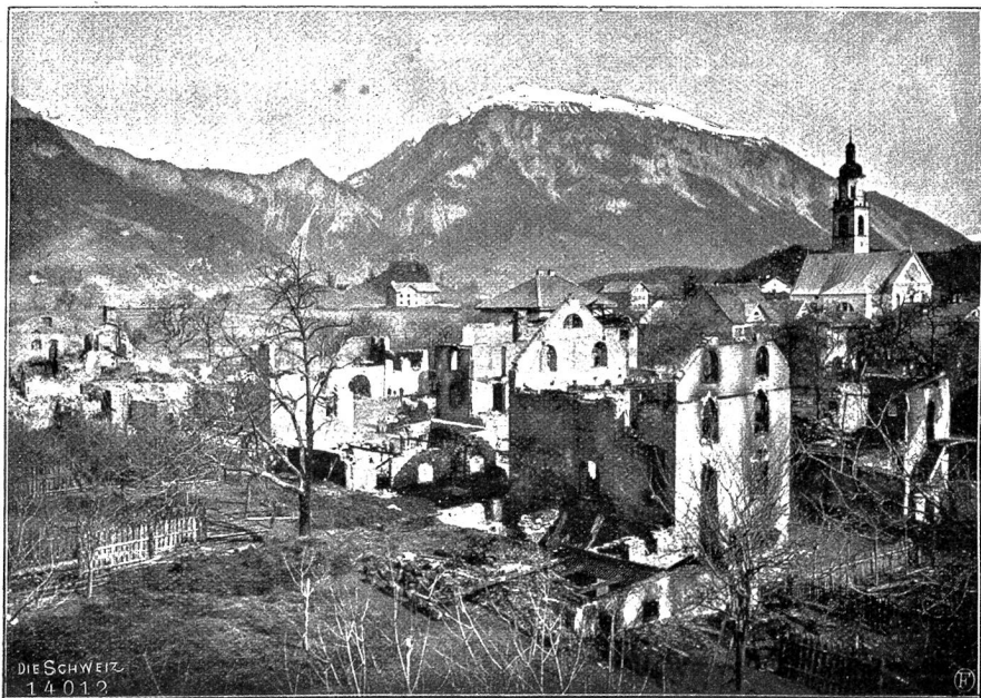
Rhäzüns im Domleschg. Brandstätte.